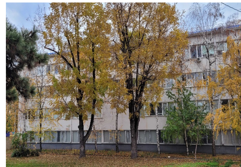
Факультет архитектуры и дизайна