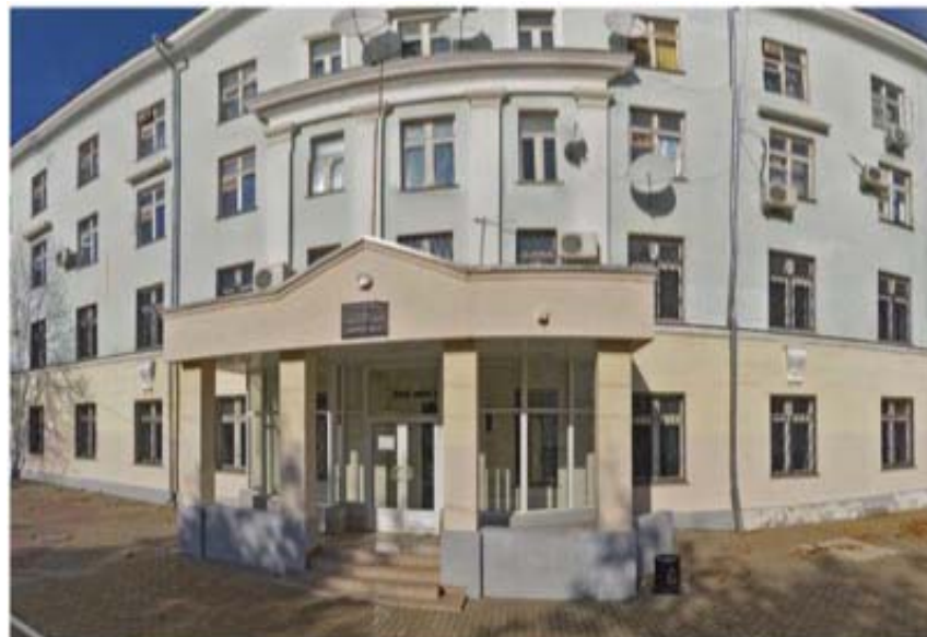
Юридический факультет им. А.А. Хмырова