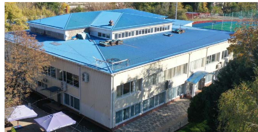
Комбинат студенческого питания