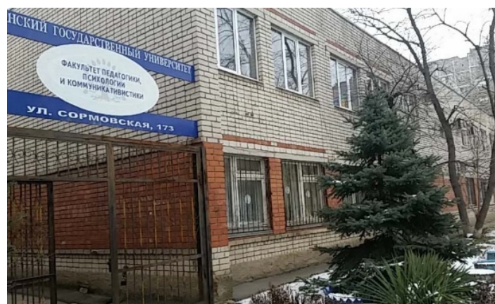
Факультет педагогики, психологии и коммуникативистики