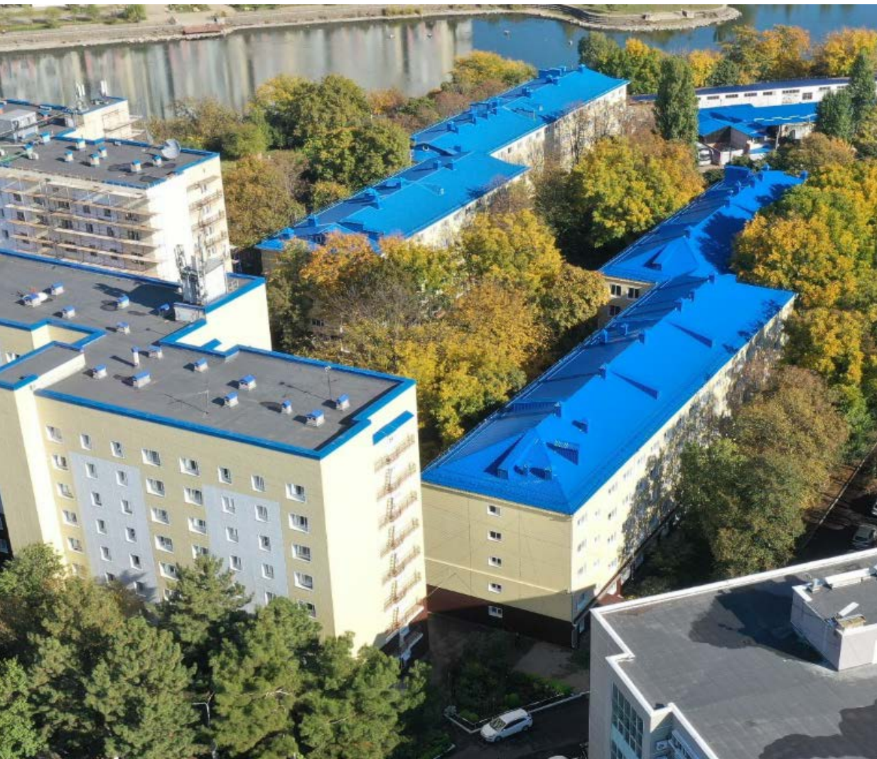
Студенческие общежития – 5 корпусов В стадии строительства – два 17-ти этажных корпуса