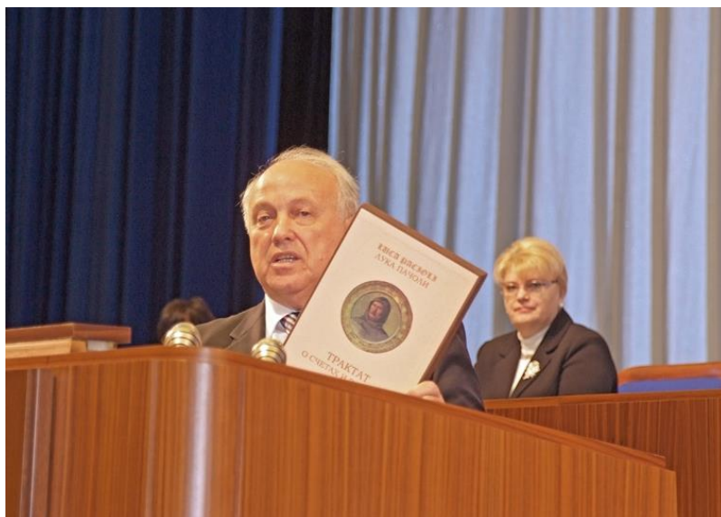
Презентация трактата в Государственном Кремлевском Дворце (2009)