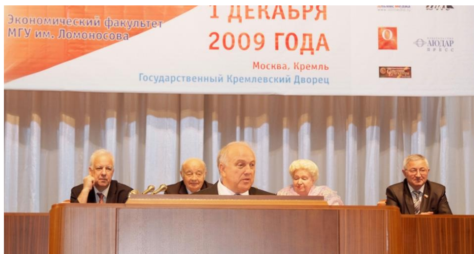
Презентация трактата в Государственном Кремлевском Дворце (2009)