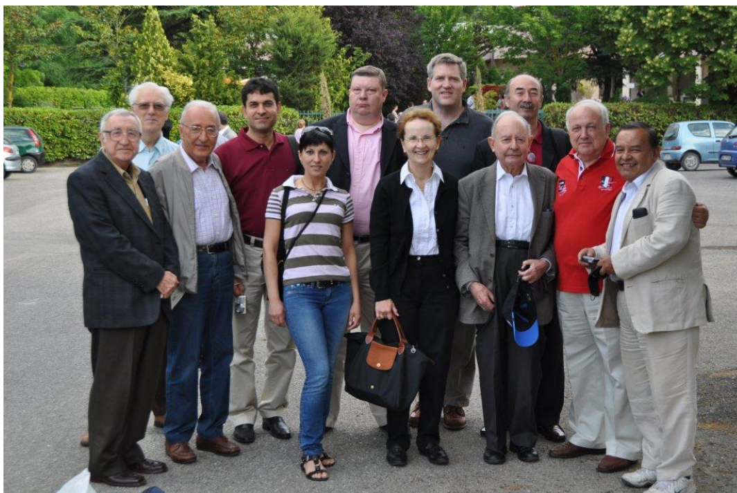
Ведущие исследователи истории бухгалтерии девяти стран на родине Пачоли (Сансеполькро, Италия, 2011)