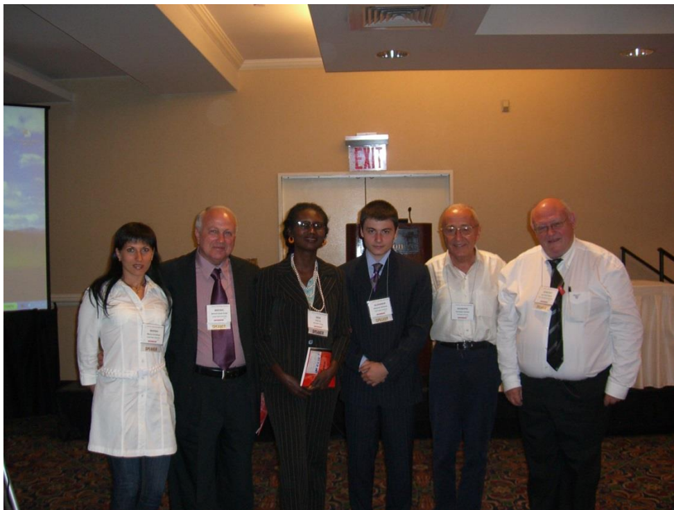
После Презентации на Конгрессе ААА в Нью-Йорке (2009)