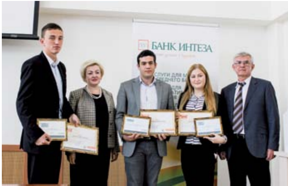
В Кубанском государственном университете состоялась церемония награждения победителей конкурса на лучший инновационный бизнес-проект среди студентов "Вместе думаем о будущем" при поддержке "Банка Интеза".