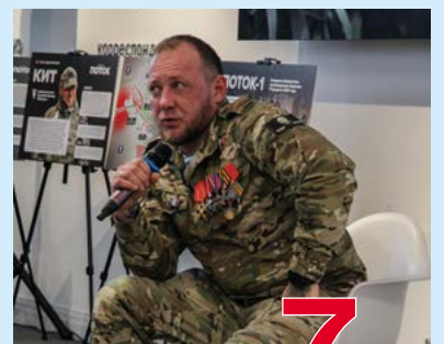
Встреча с Героем России 7 стр.