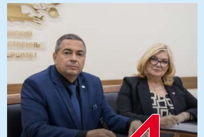
Соглашение о сотрудничестве 4 стр.