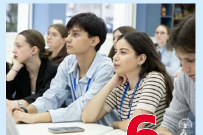
Школа кураторов 6 стр.