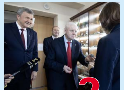
Сергей Миронов посетил КубГУ 2 стр.