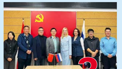
Расширяем сотрудничество с КНР 3 стр.