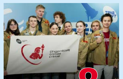
Слет студотрядов 8 стр.