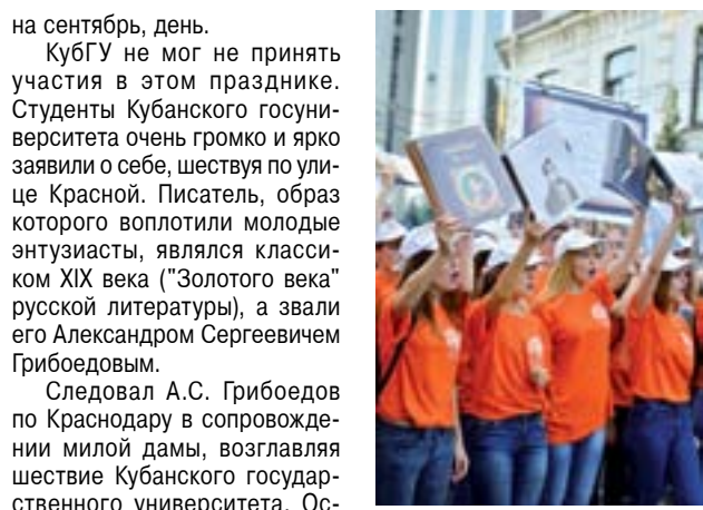
лепную сатиру А.С. Грибоедова, размахивая плакатами с цитатами из «Горя от ума».

27 сентября краснодарцы отметили сразу два праздника: День города и День первокурсника. Причем нынешний праздник студентов вышел за границы своих традиционных рамок: привычное «Чайное шествие» заменили на «Литературное Путешествие». Связано это преобразование с тем, что 2015 год в России объявлен Годом литературы.