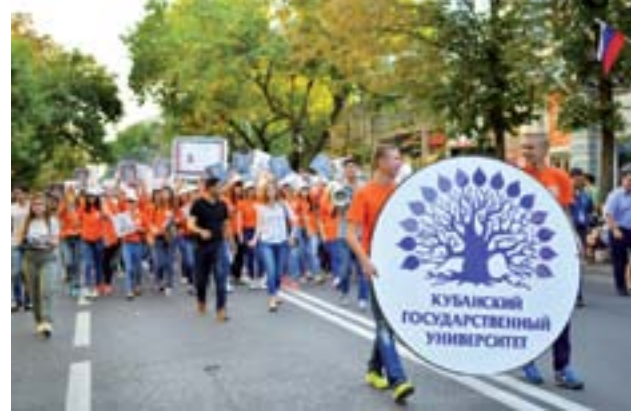
на сентябрь, день.

«Александр Сергеевич, стойте! Видите, лошадь не идет, вы и так сильно оторвались», — прокричал юноша, выскочивший из толпы зрителей. «Но что же делать?» — возразил обескураженный Грибоедов. «Танцуйте вальс, милейший, больше ничего не поделаешь...» - неожиданно прозвучало в ответ, после чего великий русский писатель XIX века начал вальсировать со своей дамой по главной улице Краснодара.