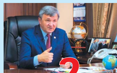
Юбилейный 2-3 стр. Марафон столетия КубГУ