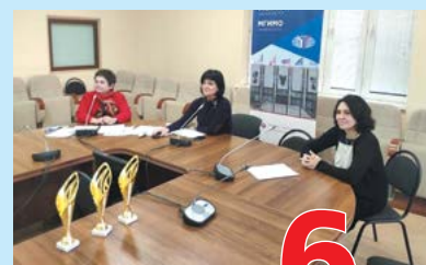
Международный студенческий конкурс чтецов 6 стр.