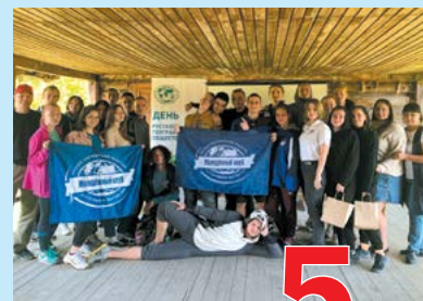
У географов – юбилей! 5 стр.