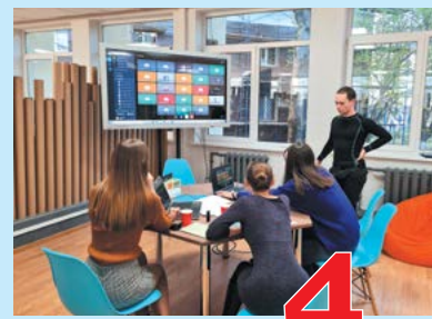
Студенты и наука 4 стр.