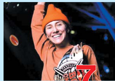
Студентка КубГУ 7 стр. двукратная чемпионка мира по брейк-дансу