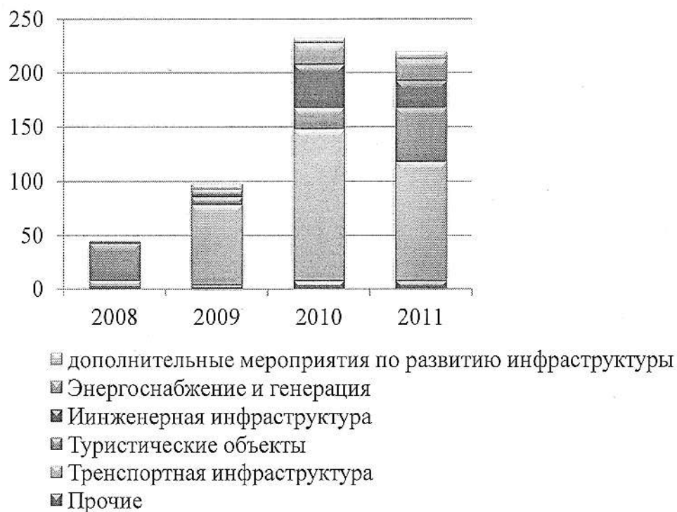
Рисунок 2 – Капитальные расходы (млдр.руб.) на развитие обеспечивающей Игры инфраструктуры.

Таким образом, в период с 2008 по 2010 год объём капитальных затрат на сопутствующие мероприятия неуклонно рос, а в 2011 начал падать. Можно сделать вывод о том, что 2010 год является пиком капитальных затрат на развитие инфраструктуры игр в Сочи.