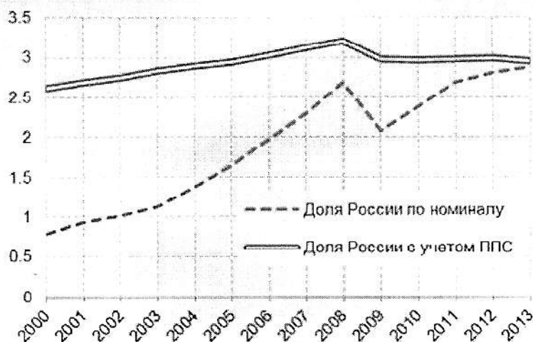
Рисунок 1 – Динамика доли России в мировом ВВП

Россия, как и прежде, удерживает шестое место в мире по общему объему экономики, отставая от лидера США в 6,5 раз, а от занимающей пятое место Германии на 26 процентов. Объем российской экономики всего на 6 процентов превышает объем идущей на седьмом месте Бразилии, что обостряет соперничество между странами БРИКС. Впрочем, все эти арифметические изыски имели бы мало смысла, если бы не одно «отягчающие» обстоятельство [11].