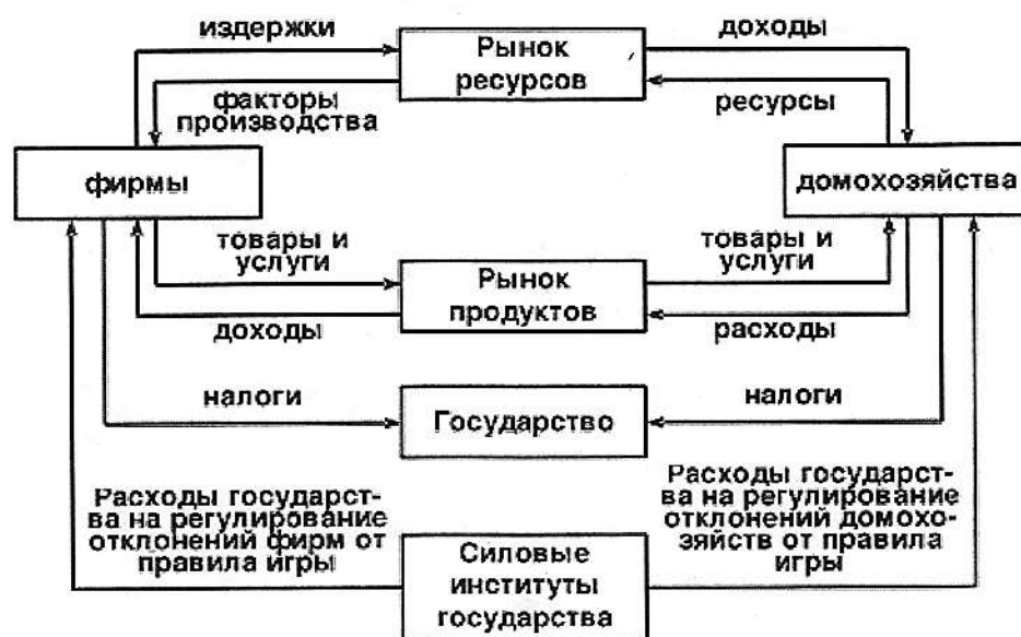
Рисунок 1 - Классическая модель ГРЭ

Классическая модель, (рисунок 1), предполагает минимальное вмешательство в экономику и основана на концепции А. Смита, где государство – это «ночной сторож» рыночной экономики. В соответствие с этой концепцией – бизнес производит и потребляет, государство занимается охраной права собственности и мягко воздействует на «правила естественной игры» предпринимателей и рабочих, потребителей и производителей, вытекающие из законов рынка. Но оно должно жестко реагировать на отклонение от «естественных правил» собственности, вплоть до применения силы (права, суд, армия, полиция и т.д.) [1].