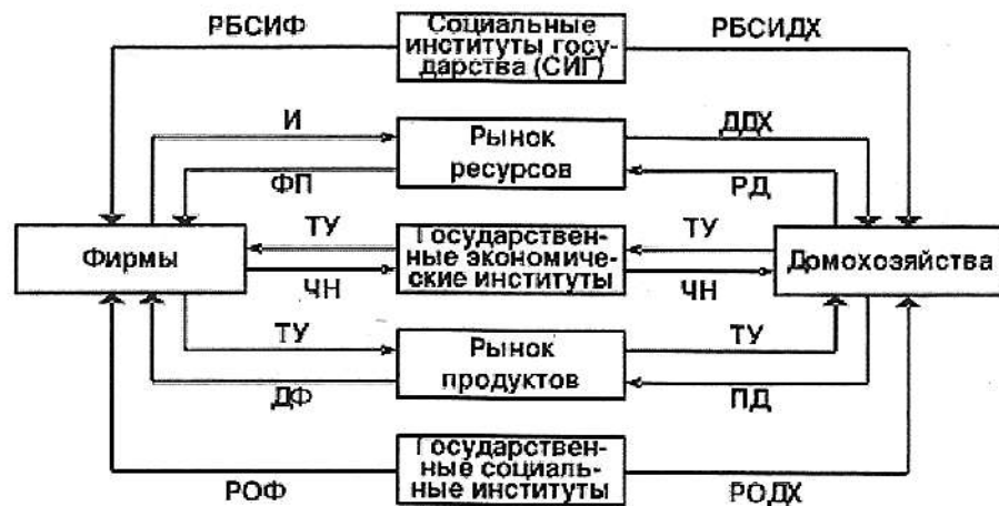
Рисунок 3 - Институционально-социальная модель ГРЭ

Институционально-социальная модель является самой сложной по составу факторов. Ее непросто представить чисто количественно. Она показывает пределы узких (специальных) макроэкономических подходов к столь непростым явлениям, как воздействие государства на хозяйственную жизнь общества, воплотив в себя элементы двух предыдущих моделей.