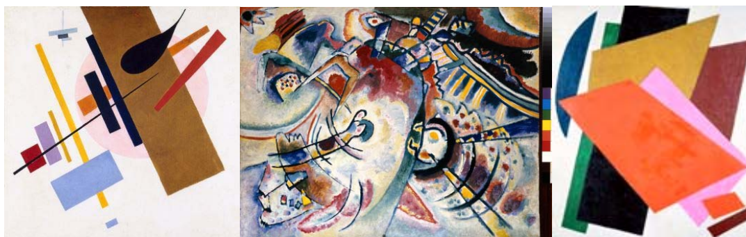
К.Малевич -«Супрематизм» K.Malevich - "Suprematism"

За последние 2 года с 2016-2017 гг. музей принял участие в мировых проектах: выставка в MoMa New York, освещает события в культурной жизни новой России, которые связаны с художественным прорывом; выставка в Tate Modern: Королевской Академии Художеств и галерее Тейт Модерн, основная часть экспозиции – редкие плакаты, фотографии, графика и агитационные материалы; выставка в Royal Academy of arts – показ перехода от радостных настроений сразу после революции и надежд художников на формирование нового «народного» искусства; выставка в Еврейском музее: «До востребования. Коллекции русского авангарда из региональных музеев».