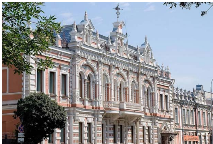
Рис.1. Историко-археологический музей имени Е.Д. Фелицына Fig. 1. Historical and Archaeological Art Museum named after E.D. Felitsyn

Музей-заповедник им. Е.Д. Фелицына был открыт в 1879 году, как первое научное, просветительское учреждение в изучении и сохранении памятников искусства и антиквариата. Музей находился и, по сей день, расположен в здании купцов – братьев Богарсуковых с богатым интерьером фасадов и единой архитектурно-художественной стилистикой.