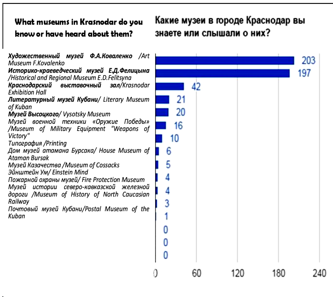
Рис. 6. Данные опроса досугового профиля среди горожан Fig. 6. Data of the survey of leisure profile among citizens

лайн-опросе приняло участие более 500 человек. Данные в большей степени представили женщины, что свойственно всем онлайн-опросам (рис. 6).