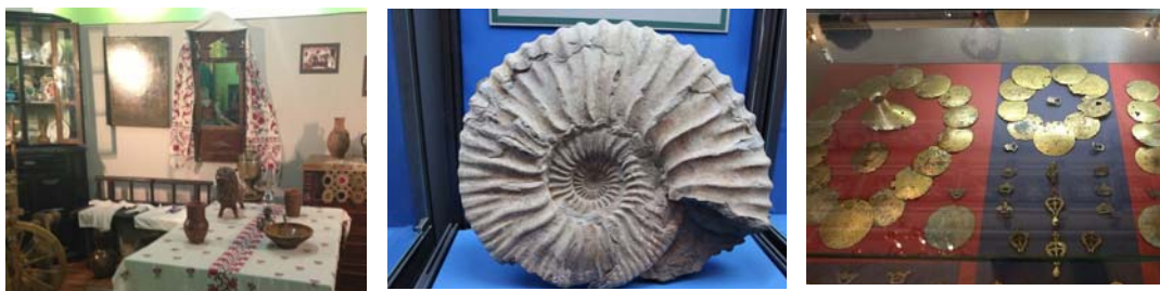
Рис. 2. Экспонаты Историко-археологического музея имени Е.Д. Фелицына Fig. 2. Exhibits of the Historical and Archaeological Museum named after E.D. Felitsyn

Второй крупный центр культурно-музейной жизни города – это Краснодарский краевой художественный музей имени Ф.А. Коваленко основанный екатеринодарским любителем искусств и собирателем Ф.А. Коваленко [4]. Музей расположен в историко-культурном центре города в начале улицы Красной – его главной градообразующей оси (рис. 2). Музею принадлежат три здания [5].