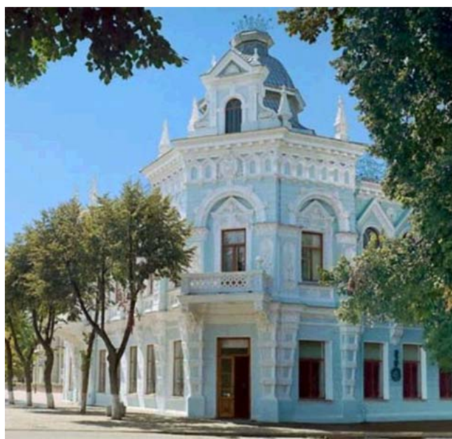
Рис. 3. Музей имени Ф.А. Коваленко Fig. 3. Art Museum named after F.A. Kovalenko