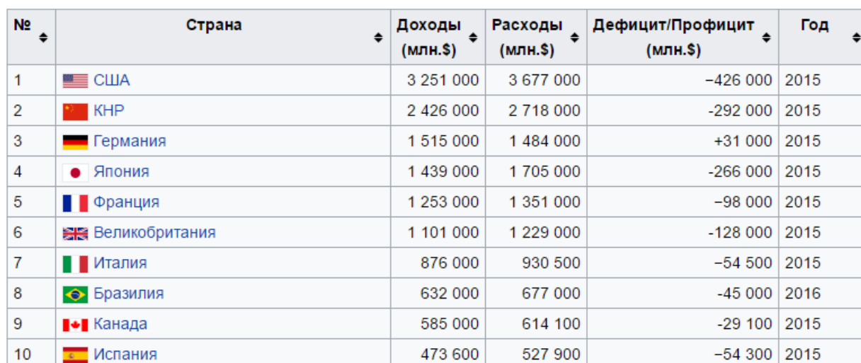
Рисунок А 1: Государственный бюджет по странам 26