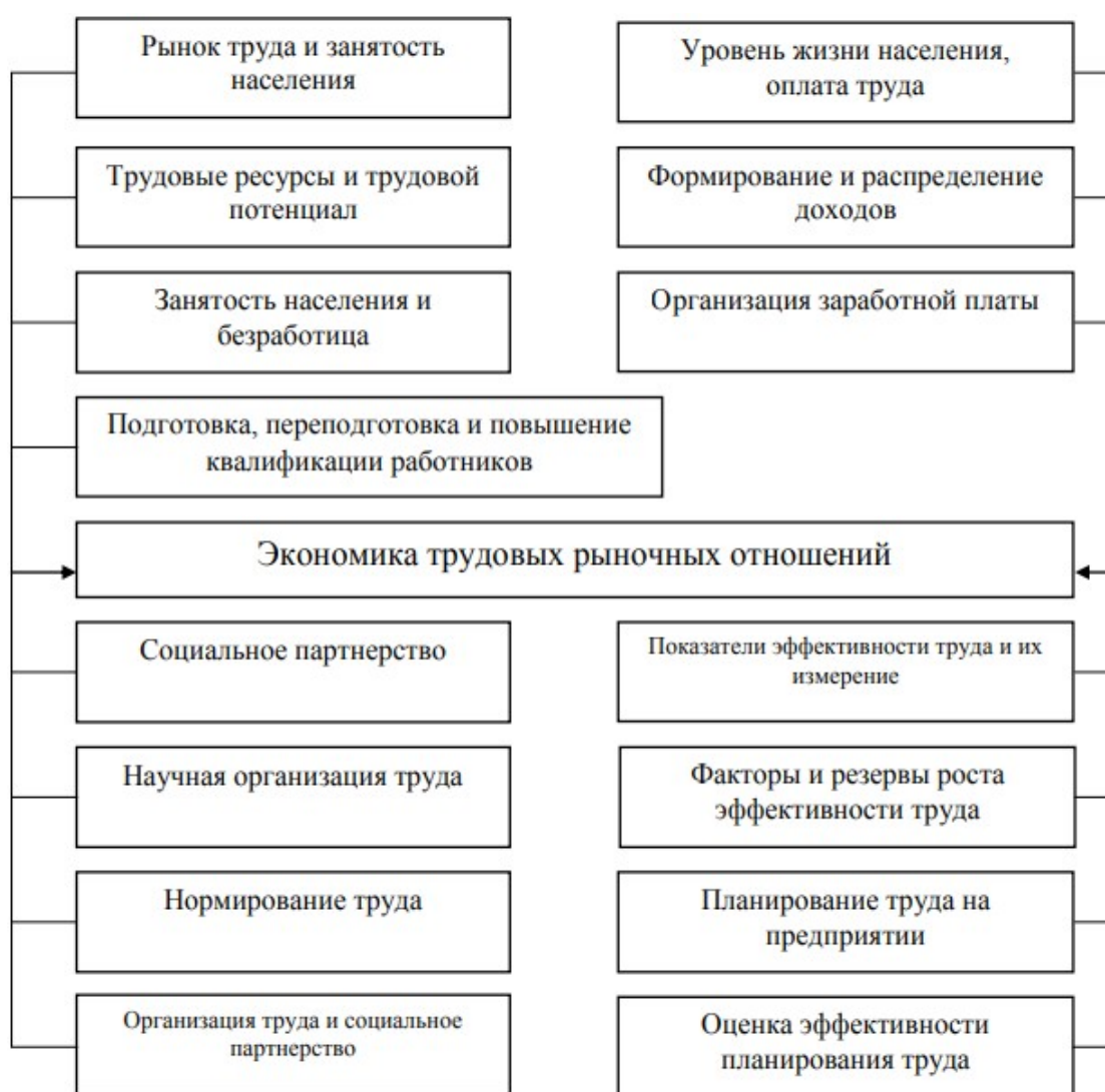
Рисунок 1 – Круг проблем, охватывающих трудовые отношения

Круг проблем, охватывающих трудовые отношения, отражен на рисунке 1.