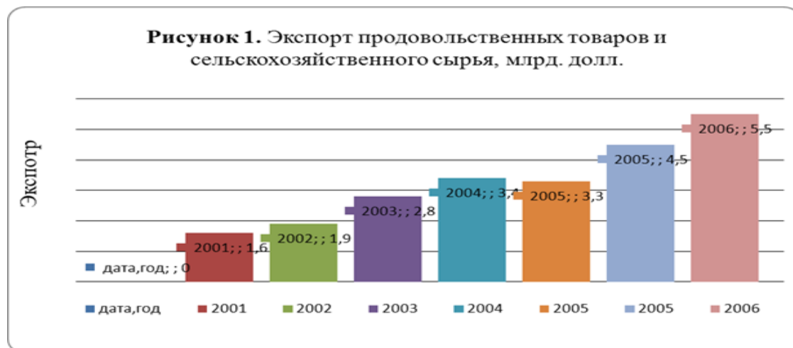
Рисунок 3 – Экспорт сельскохозяйственных товаров и сельскохозяйственного сырья

АПК играет всё более активную роль на внешнем рынке. Экспорт сельскохозяйственной продукции и продовольствия достиг более 5 млрд. долл. Экспорт сельскохозяйственных товаров и сельскохозяйственного сырья представлен на рисунке 1.