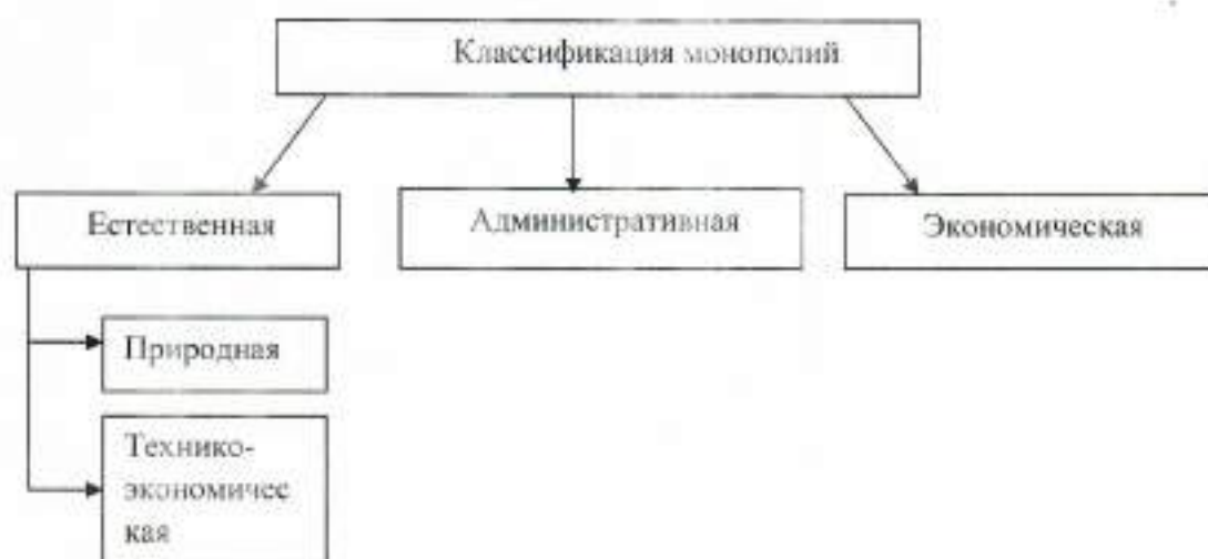
Рисунок 1 - Классификация монополий [2, с. 237].

Объективной основой монополизма является доминирующее положение хозяйствующего субъекта на рынке, что позволяет ему оказывать решающее влияние на конкуренцию, завышать цену и снижать объем производства по сравнению с теоретически возможным уровнем, затруднять доступ на рынок другим хозяйствующим субъектам. В конечном итоге это дает возможность монополисту перераспределять в свою пользу платежеспособный спрос, получать монопольно высокую прибыль. Конкурентные рынки в целом работают хорошо, чего нельзя сказать о рынках, на которых или покупатели, или продавцы могут манипулировать ценами. На рынке, где один продавец контролирует предложение выпуск продукции будет малым, а цены – высокими. Продавец обладает монопольной властью, если он может повышать цену на свою продукцию путем ограничения своего собственного объема выпуска. На монопольных рынках существует барьер вхождения, который делает невозможным проникновение на рынок любого нового продавца. Фирма, обладающая монопольной властью, проводит политику ценовой дискриминации, то есть продает один и тот же товар разным группам потребителей по разным ценам. Но для этого фирма-монополист должна уметь разделять свой рынок, ориентируясь на разную эластичность спроса у разных потребителей, умело отделять «дешевый» рынок от «дорогого» [11, с. 234].