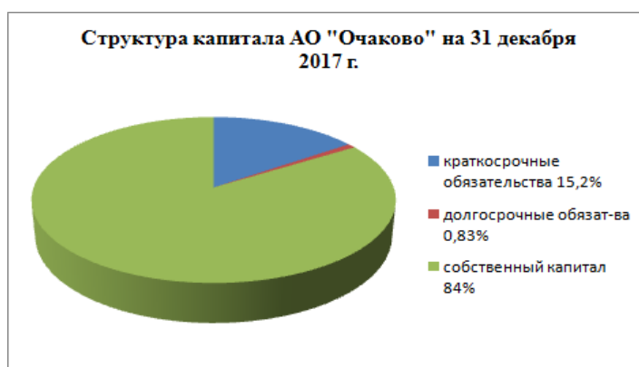
Рисунок 2.1 — структура капитала АО МПБК «Очаково»

Ниже на диаграмме наглядно представлено соотношение собственного и заемного капитала организации (Рисунок 2.1).