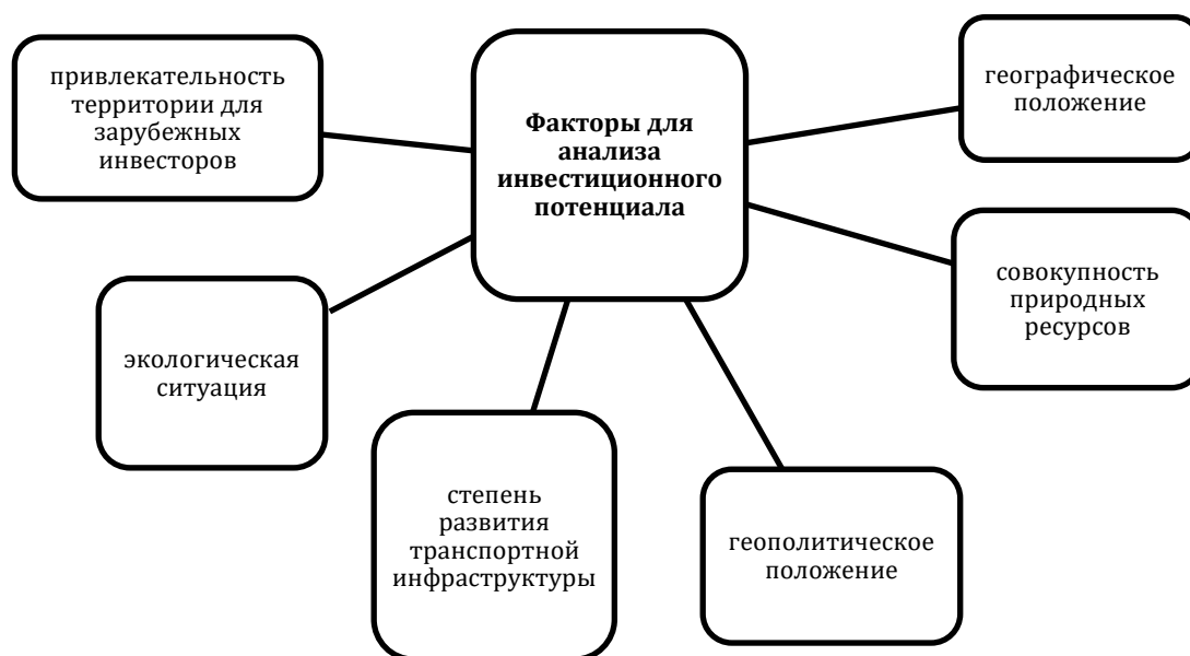
Рисунок – 1 Инвестиционный потенциал региона

Осуществляя государственную инвестиционную политику в России необходимо помнить о контроле над регионами. В реализации инвестиционной политики большие государства, такие как Россия, должны учитывать специфику экономического развития всех регионов, входящих в его состав. При этом уделяется особое внимание инвестиционному потенциалу регионов. Для этого учитывают следующие факторы [6] (рисунок 1).