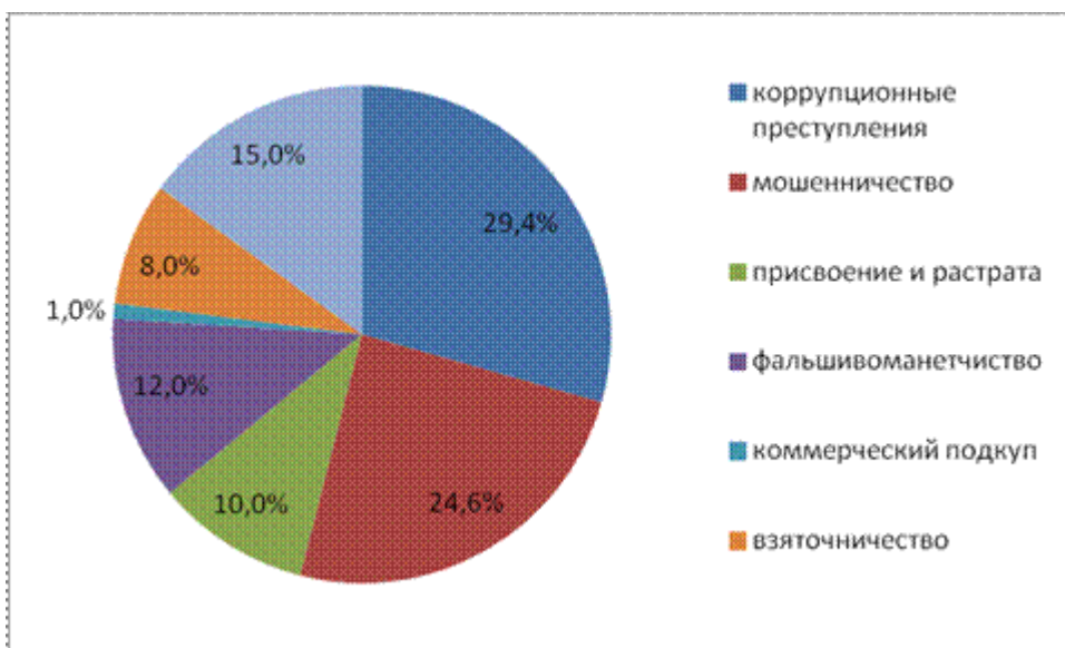
Рисунок 2 - Уровень коррупции

Как показывает статистика за 2015 год, представленная на рисунке 2, уровень коррупции преобладает в структуре экономической преступности.