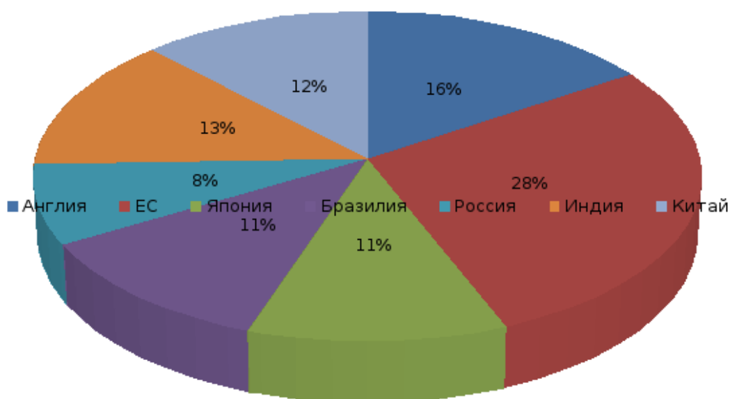
Рисунок 3 – Сравнительный анализ инвестиционного климата России и других стран по данным исследования Bloomberg Markets Global Investor Poll [17]

процедур сократилось до пяти, а количество дней на их прохождение – до 162. Также в России упростилось ведение международной торговли. Это стало результатом внедрения электронной системы подачи документов по экспорту и импорту и сокращения числа физических проверок. По уплате налогов Россия поднялась с 64-го на 56-е место.