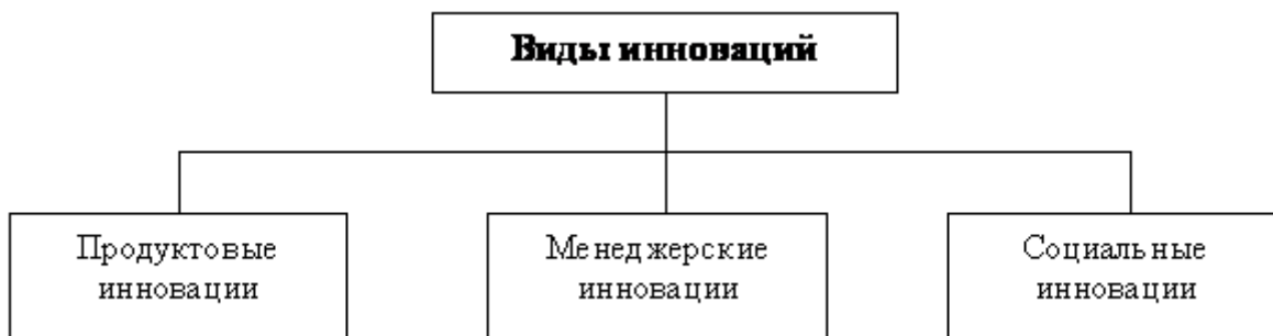
Рисунок 1 – Основные виды инноваций [1]

Предлагаемая на рисунке 1 классификация инноваций составлена по признаку содержания и принципиально не отличается от классификации П. Друкера, она уточняет и детализирует ее.