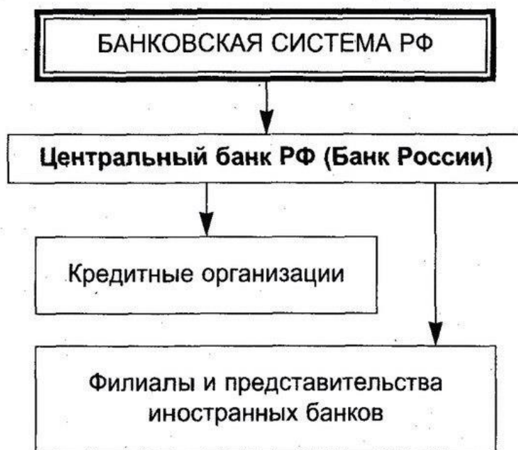
Рисунок 1 – Структура банковской системы РФ [13, ст 2, 4]

Современная банковская система России создана в результате реформирования государственной кредитной системы, сложившейся в период централизованной плановой экономики. (рис. 1) Банки в РФ создаются и действуют на основании Федерального закона от 7 июля 1995 г. № 395-1 «О банках и банковской деятельности» [13], в котором дано определение кредитных организаций и банков, перечислены виды банковских операций и сделок, установлен порядок создания, ликвидации и регулирования деятельности кредитных организаций и т.п. В действующем законодательстве закреплены основные принципы организации банковской системы России, к числу которых относятся следующие: двухуровневая структура, осуществление банковского регулирования и надзора центральным банком, универсальность деловых банков и коммерческая направленность их деятельности [20, с. 78-80].