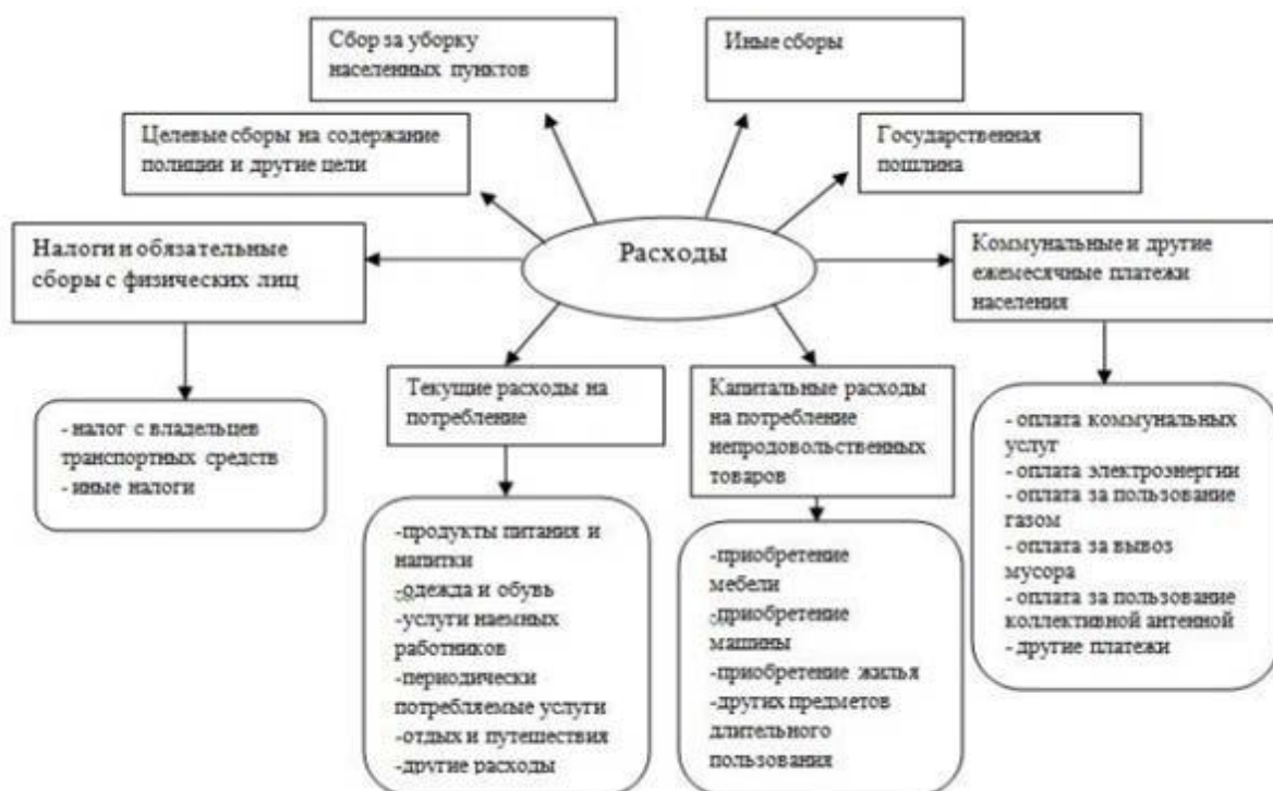
Рис.4 – Расходы домашних хозяйств на потребление.

На рис.4 изображены расходы семейного бюджета на потребление: