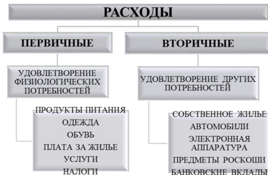
Рис.3 – Структура Расходов семьи.

Кроме регулярных затрат допустимы и нерегулярные (эпизодические) расходы - покупка мебели, бытовой техники и электроники. Помимо этого,