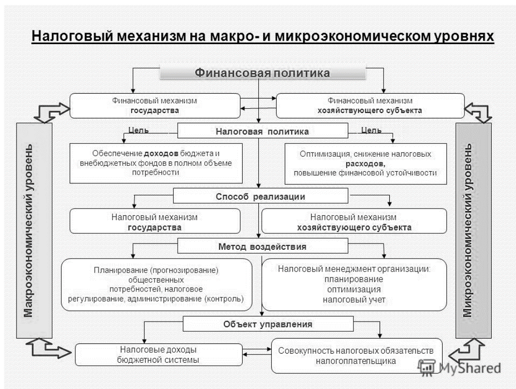
Рисунок 1- Налоговый механизм на макро- и микроэкономических уровнях [17]

В условиях рыночной экономики денежные единицы перемещаются от потребителей к бизнесу, когда потребители покупают товары или услуги. Правительство полагается на налоговые поступления от рыночной экономики. Бизнес оплачивает налог с продаж, исходя из цены товара. Другие налоги включают корпоративный подоходный налог, основанный на прибылях бизнеса.