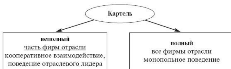
Схема 2.1 Виды картельных соглашений

В мировой практике существуют следующие виды картельных соглашений: