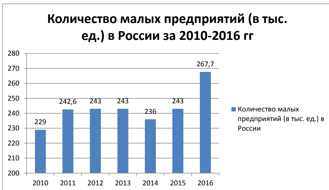
Рисунок 2 - Динамика количества малых предприятий (в тыс. ед.) в России за 2010-2016 г.г. [10, стр 27]

которая отражена в данных органов государственной статистики начиная с 2010 года.