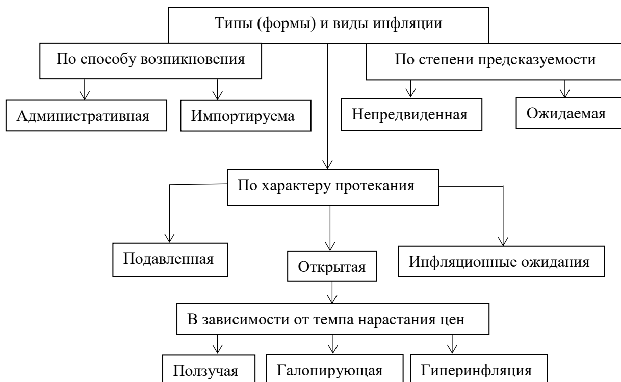
Рисунок 1– Типы (формы) и виды инфляции [2]

Если говорить о видах инфляции, то в зависимости от темпов нарастания цен можно выделить 3 вида инфляции: