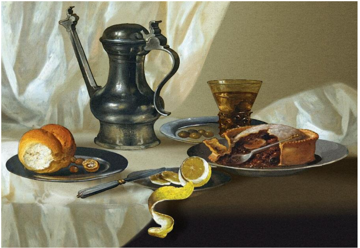
Рисунок 3. Итоговое изображение натюрморта