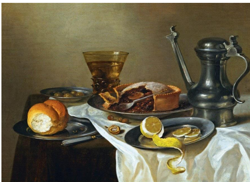
Рисунок 1. Исходный натюрморт

Для выполнения задания мной был выбран натюрморт голландского живописца, мастера натюрморта Виллема Клас Хеды состоящий из следующих предметов: кофейник, тарелка с пирогом, бокал, тарелка с лимоном, тарелка с булкой, орехи, блюдце с оливками, нож для масла, белая драпировка. Композиция натюрморта горизонтальная, освещение естественное. Для комфортной работы следует выбрать натюрморт с наиболее высоким разрешением. (Рисунок. 1).