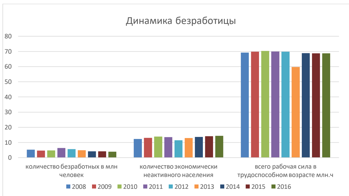
Рисунок 1 Динамика безработицы

отмечается постепенное понижение числа безработных, во многом благодаря внедрению разработанных Правительством программ снижения безработицы. Графически данная информация, представлена при помощи рисунка 1.