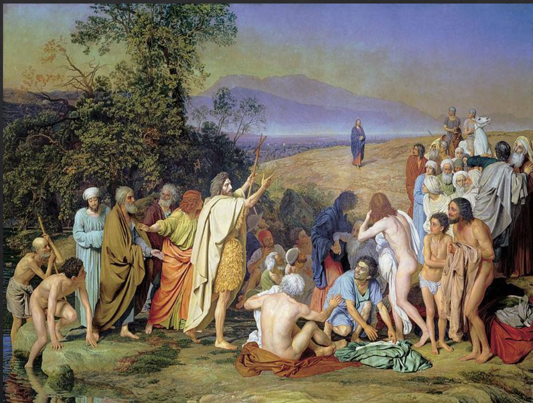
А. Иванов. «Явление Христа народу»