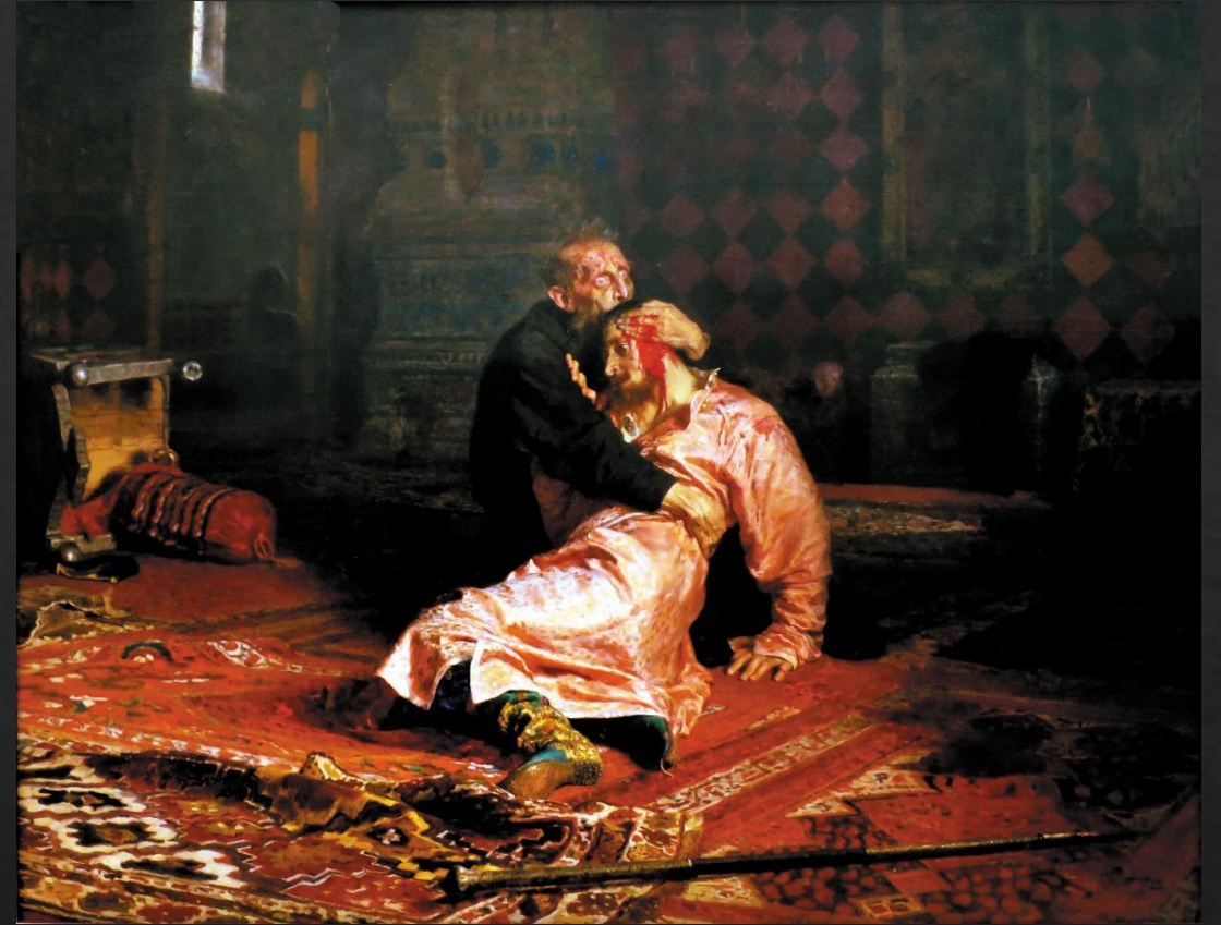
Репин Илья Ефимович. «Иван Грозный и сын его Иван»