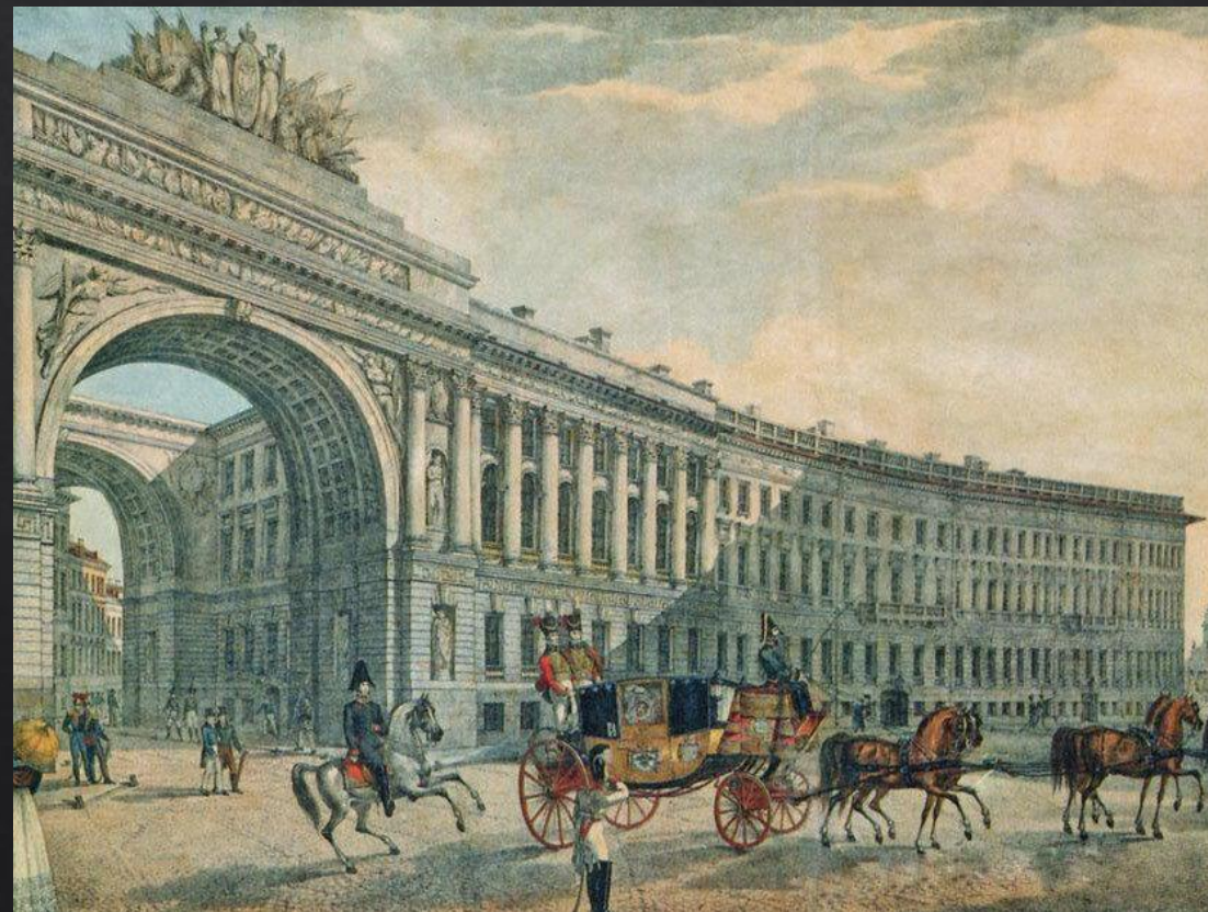
Карл Беггров. «Арка главного штаба»