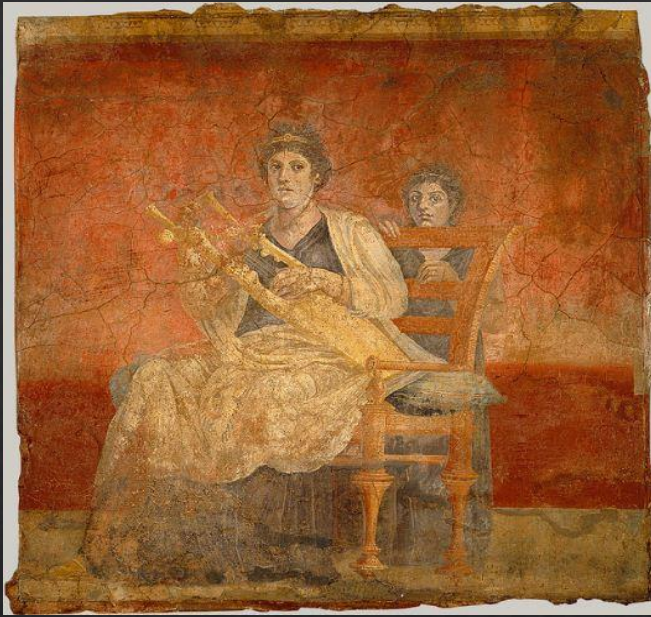
Монументальная фреска из оформления виллы в Боскореле.