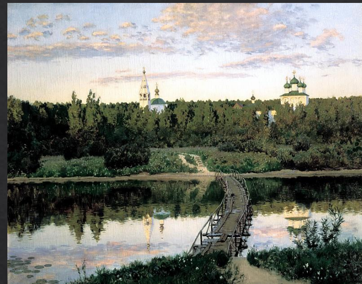
Левитан Исаак. «Тихая обитель»