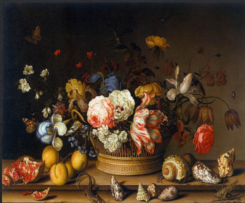
Бальтазар ван дер Аст. «Корзина с цветами и фруктами»