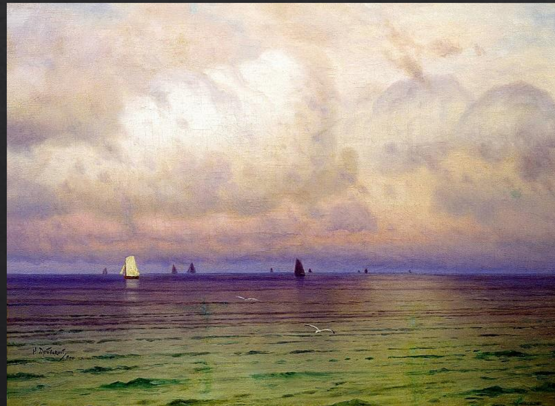
Дубовской Николай. «Море. Парусники»