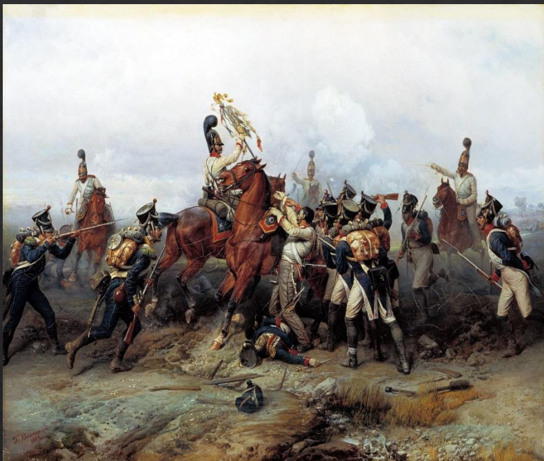
Виллевальде Богдан (Готфрид) Павлович. «Подвиг конного полка в сражении при Аустерлице в 1805 году»