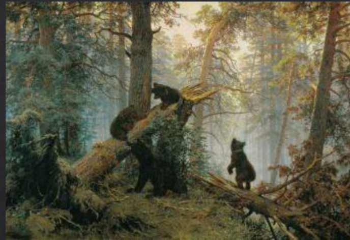
Иван Шишкин. «Утро в сосновом лесу»