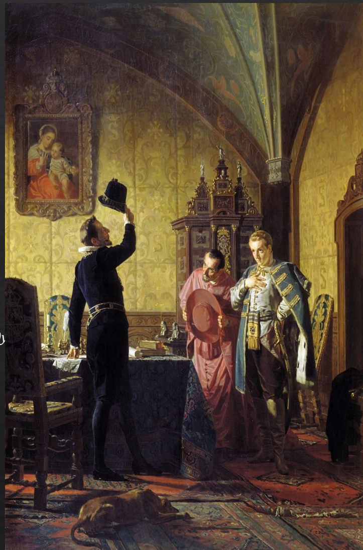
Неврев Николай Васильевич. «Присяга Лжедмитрия I польскому королю Сигизмунду III на введение в России католицизма»