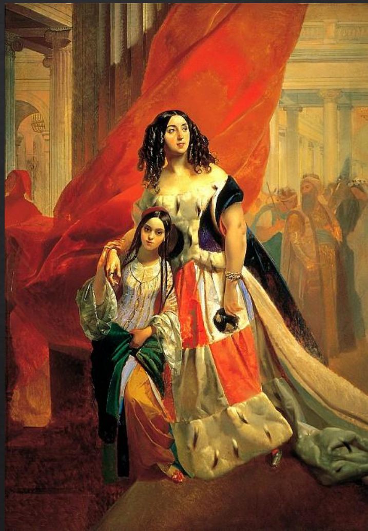
Брюллов Карл. «Портрет графини Юлии Павловны Самойловой, удаляющейся с бала с приёмной дочерью Амацилией Паччини»