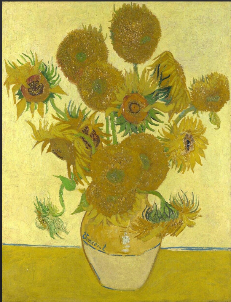
Ван Гог. «Подсолнухи»