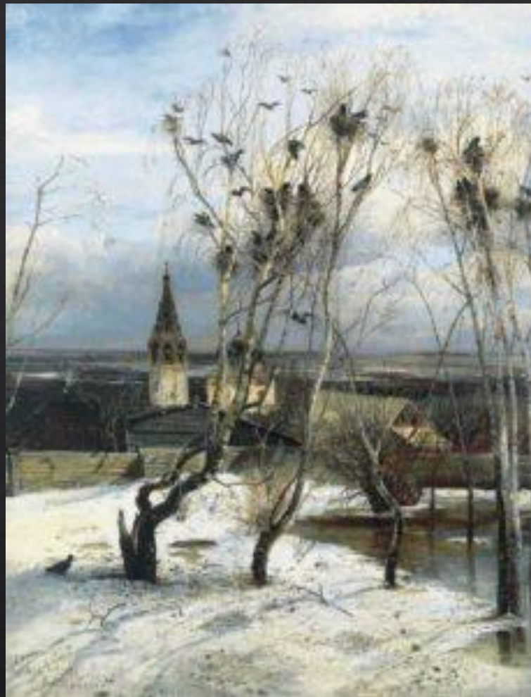
Алексей Саврасов. «Грачи прилетели»