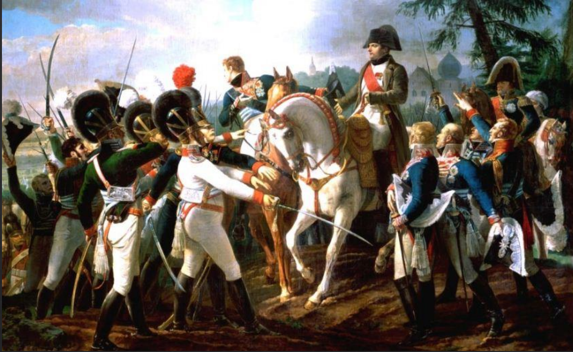
Жан — Батист Дебре. «Наполеон выступает перед баварскими войсками в Абенсберге 20 апреля 1809 года»