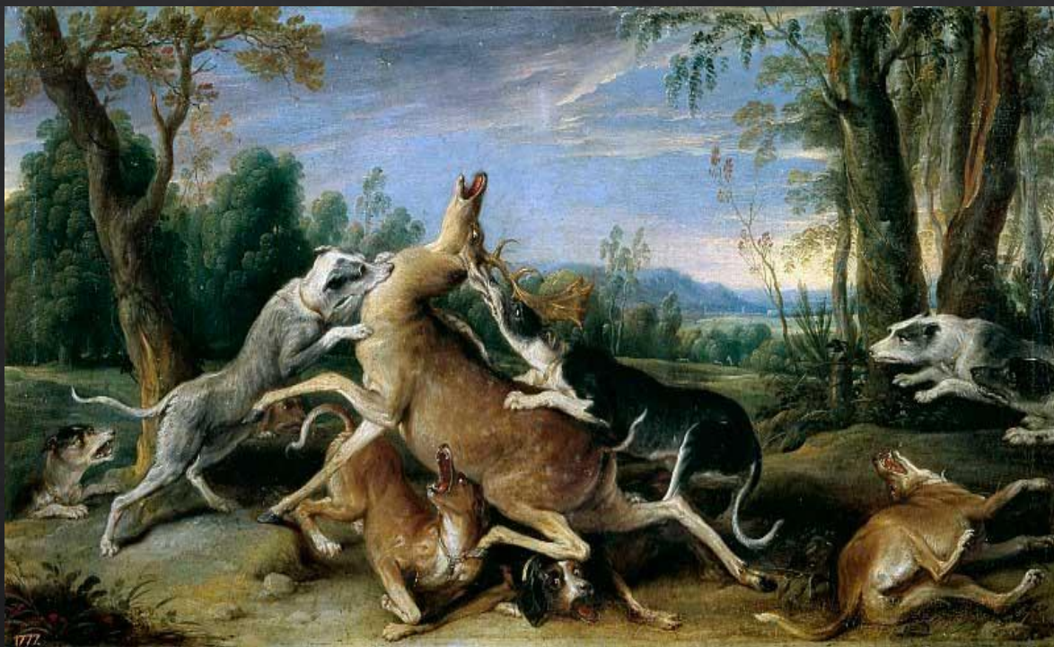
Альбрехт Дюрер. «Олень охота»