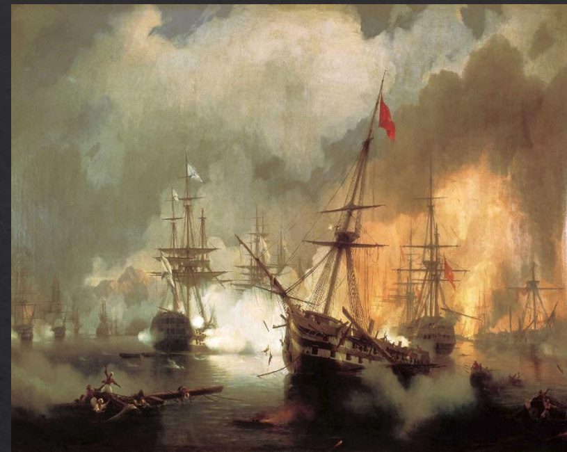
Айвазовский Иван Константинович. «Морское сражение при Наварине»