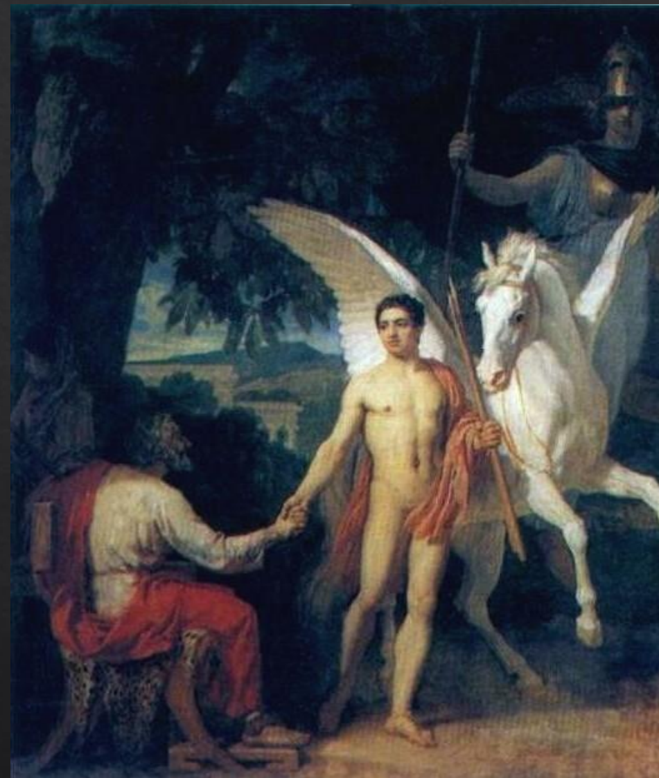
А. Иванов. «Беллерофонт, отправляющийся на войну с Химерой»