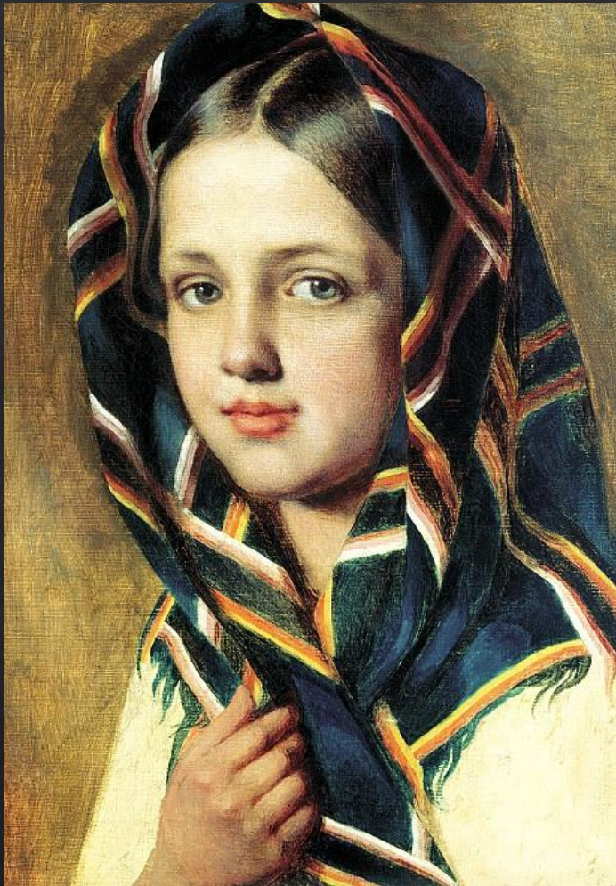
Венецианов Алексей. «Девушка в платке»