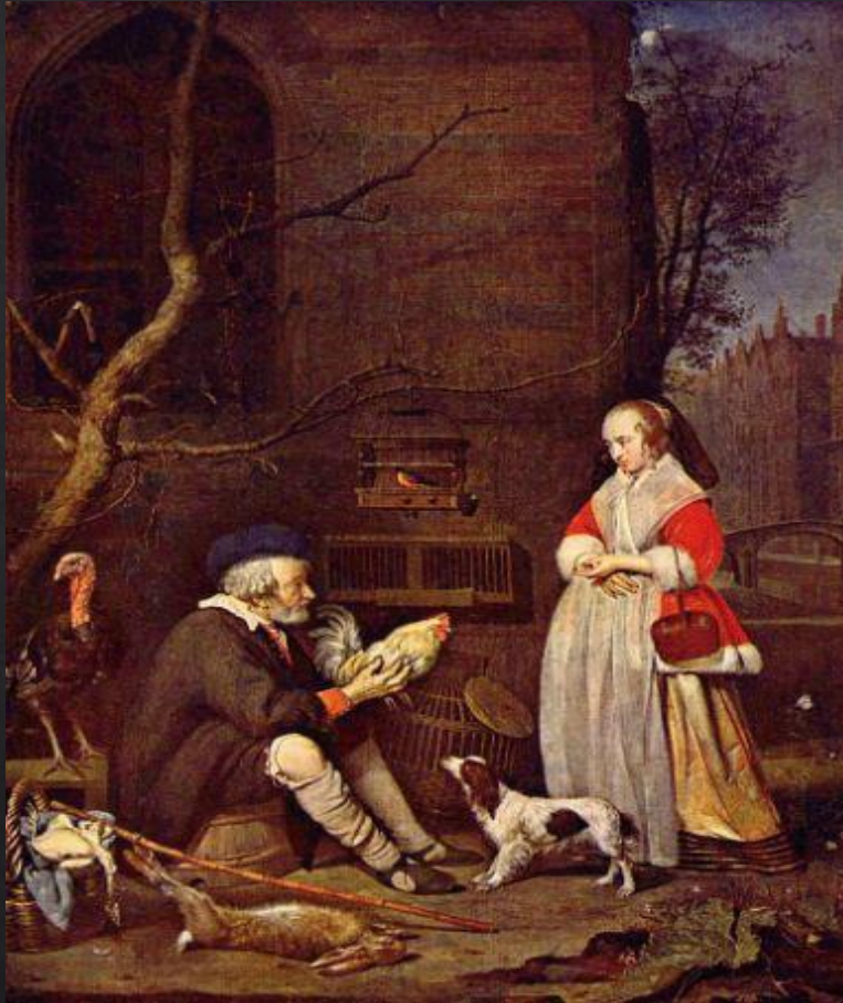
Габриель Метсю. «Продавец птиц»