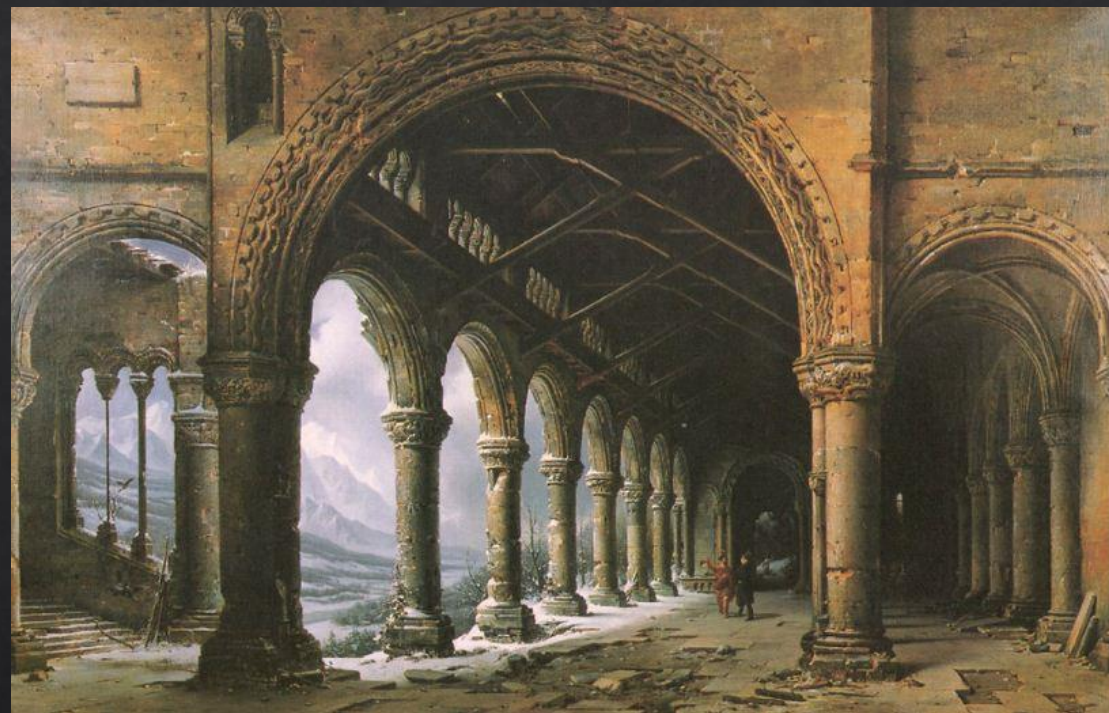
Луи Дагер. «Туман и снег, видимые сквозь разрушенную готическую колоннаду»