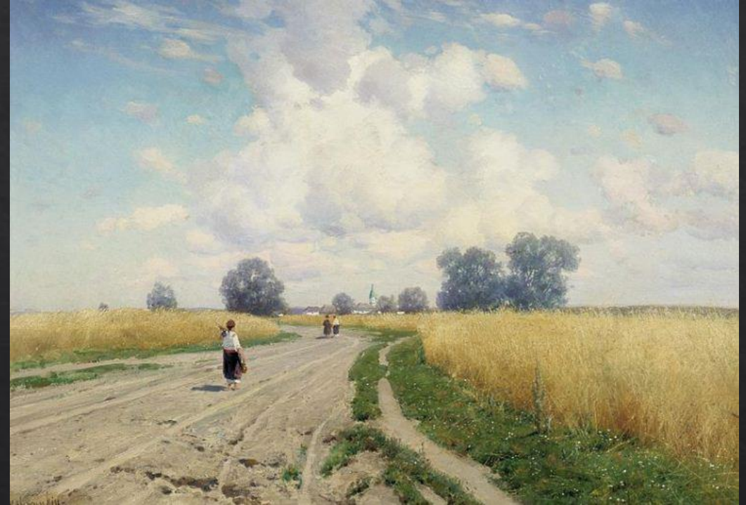
Константин Крыжицкий. «Дорога»