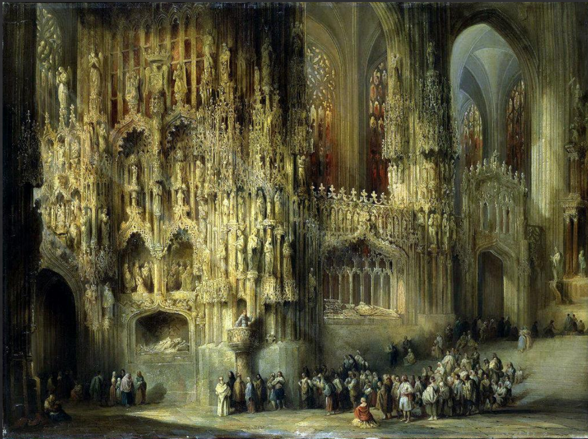
Перес де Вильямил, Хенаро. «Интерьер собора Сан-Мигель в г. Херес»