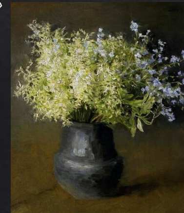
Исаак Левитан. «Лесные фиалки и незабудки»