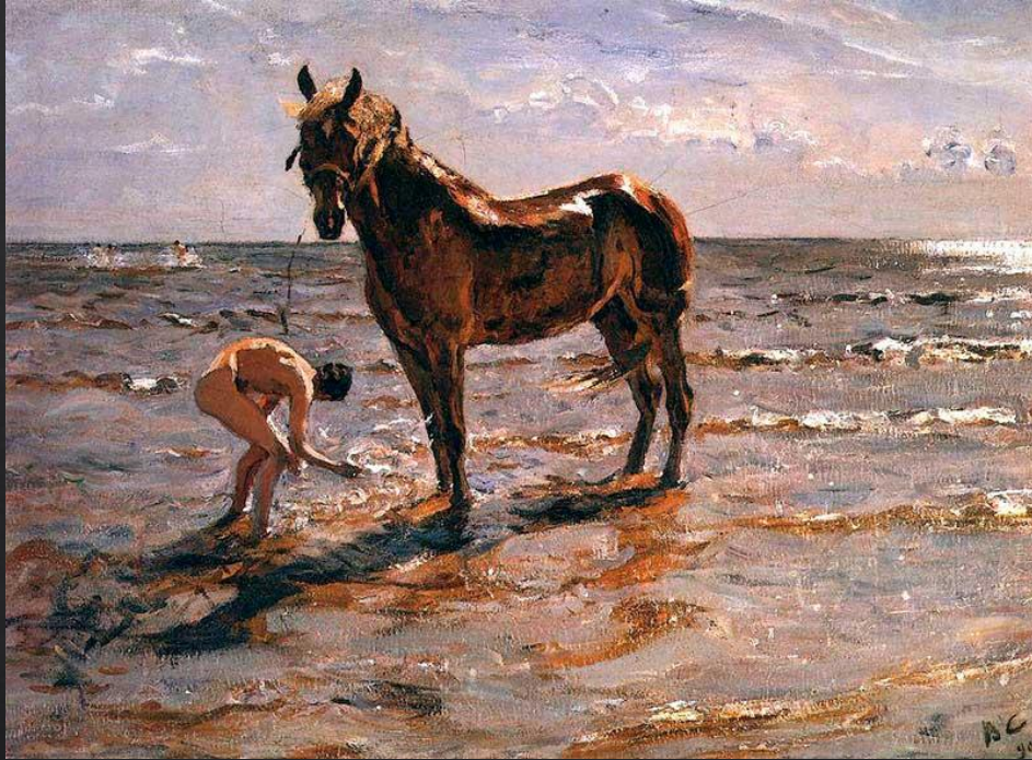
Василий Ватагин. «Купание коня»