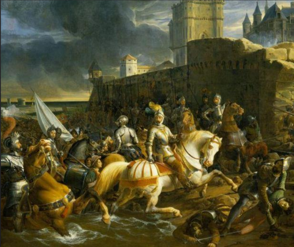
Франсуа Эдуар Пико. «Осада Кале»