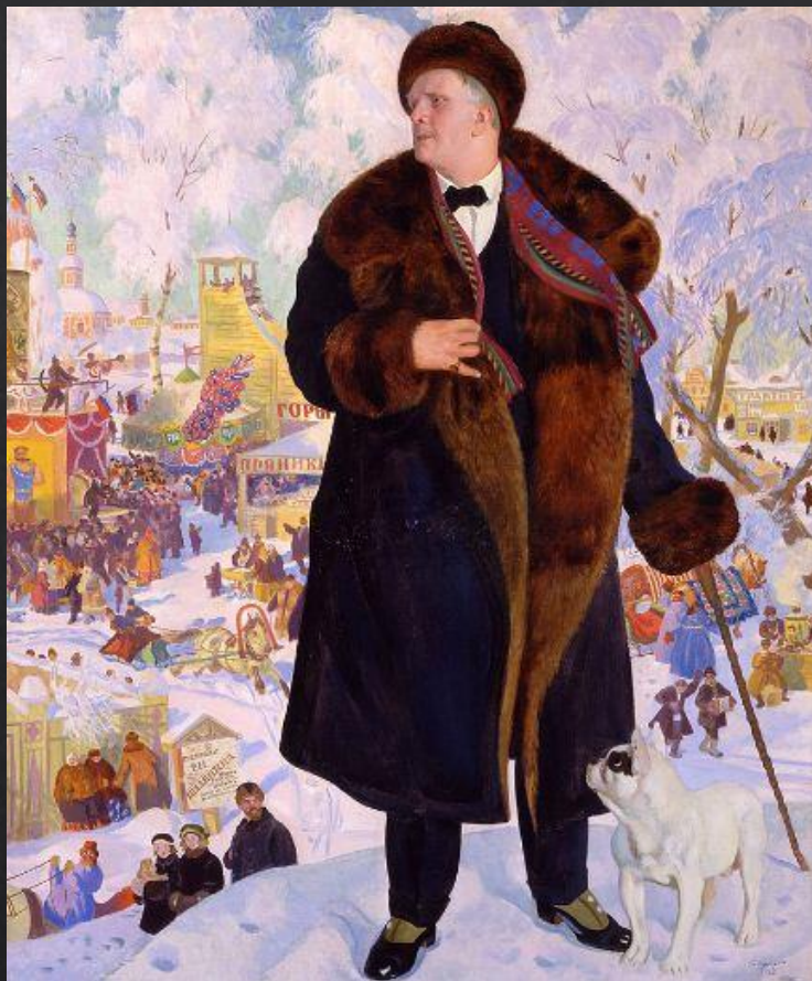
Борис Кустодиев. «Портрет Ф. И. Шаляпина»