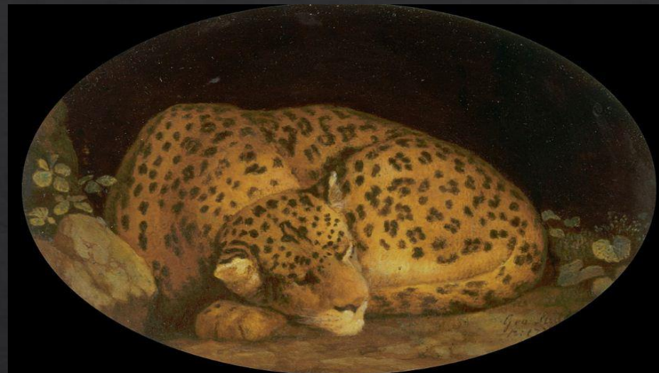
Джордж Стаббс. «Спящий леопард»