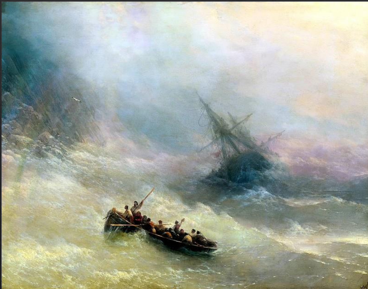
Айвазовский Иван. «Радуга»