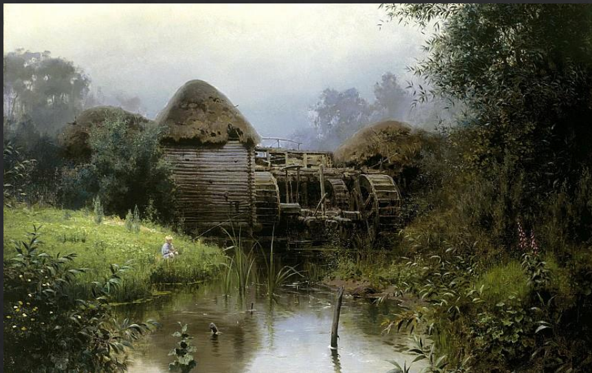
Поленов Василий. «Старая мельница»