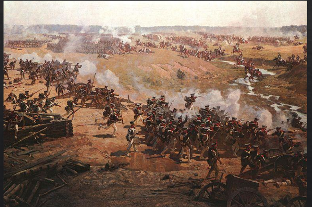
Фрагмент Бородинской панорамы