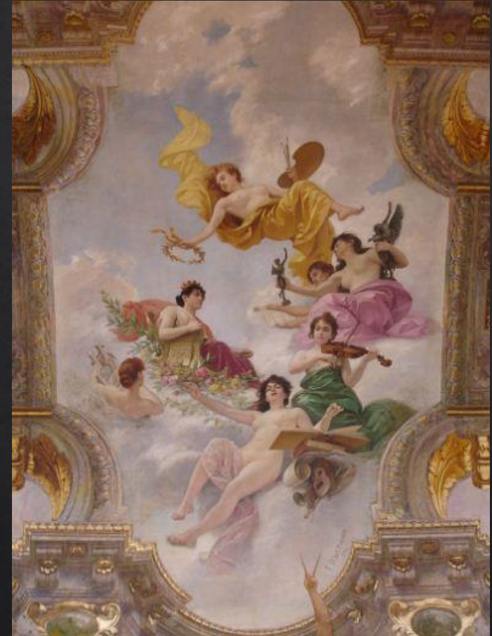
Потолок ратуши в Тулузе