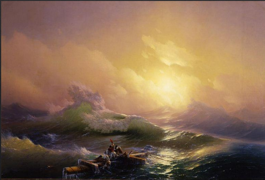
И. К. Айвазовский. «Девятый вал»