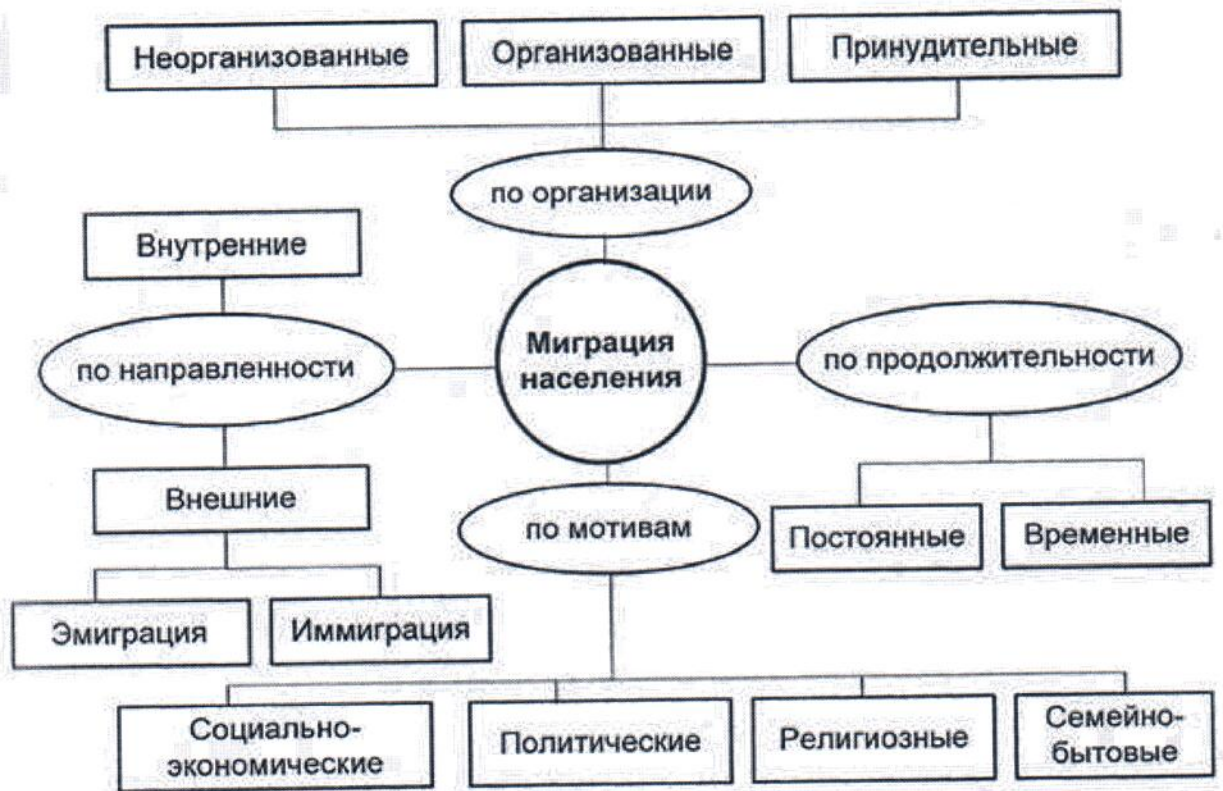
Рисунок А.1 - Типы миграции [2]