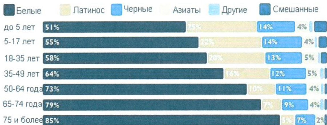
Рисунок Б. 1. – Половозрастной состав по расам на 2016 г. [14]