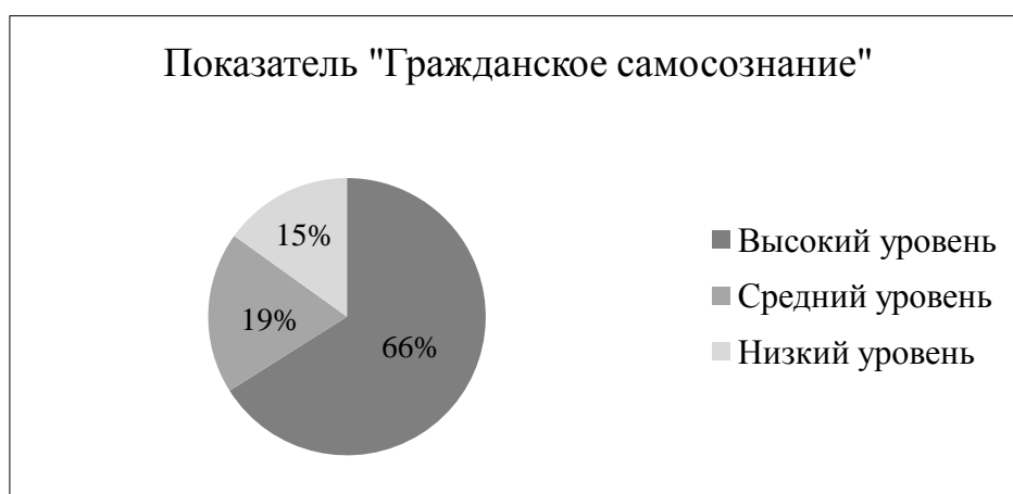
Рисунок 7 – Результат выявления степени выраженности ценностных качеств подростков по шкале «гражданское самосознание»

Пятый блок «Гражданская активность» показывает из общего числа учащихся 56%, что является средним показателем, а именно подростки принимают участие во всех видах деятельности, следуя за другими ребятами, но в отдельных случаях могут не выполнить поручение и не довести начатое дело до конца. Данные приведены на рисунке 11.