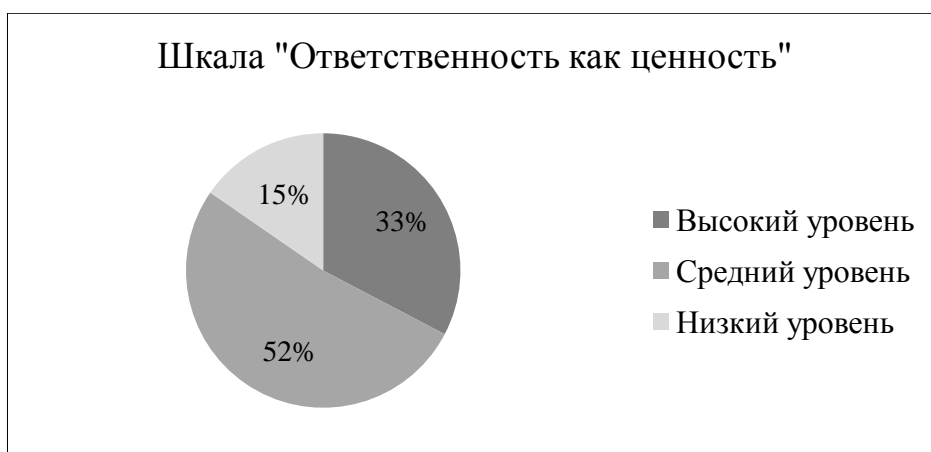
Рисунок 6 – Результат выявления степени выраженности ценностной установки у подростков по шкале «Ответственность как ценность»

По итогам первого этапа констатирующего эксперимента по исследованию ценностных ориентаций, с целью выявления уровня развития мотивационно – ценностного и личностного компонентов социальной компетентности у подростков в условиях общеобразовательной организации, показал результат выраженности степени ценностных установок, а именно 61,2% как средний показатель сформированности мотивационно – ценностного и личностного компонента социальной компетентности, включающей базовые характеристики, такие как ответственность за действия и поступки, готовность к совместной работе, проявление инициативы и ценностное восприятие окружающей социальной действительности.