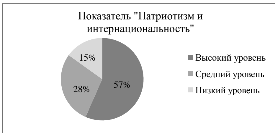
Рисунок 12 – Результат выявления степени выраженности ценностных качеств подростков по шкале «патриотизм и интернациональность»

59%, что свидетельствует о развитости чувства собственного достоинства, проявлении требовательности к себе и другим, стремлении выполнять трудные дела и поручения, не позволения унижать себя и др. Данные приведены на рисунке 13.