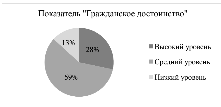
Рисунок 13 – Результат выявления степени выраженности ценностных качеств подростков по шкале «гражданское достоинство»

Проанализировав каждую шкалу, в соответствии с основными гражданскими характеристиками, можно сделать вывод, что развитие активной гражданской позиции, чувства долга, культуры правовой и политической, как