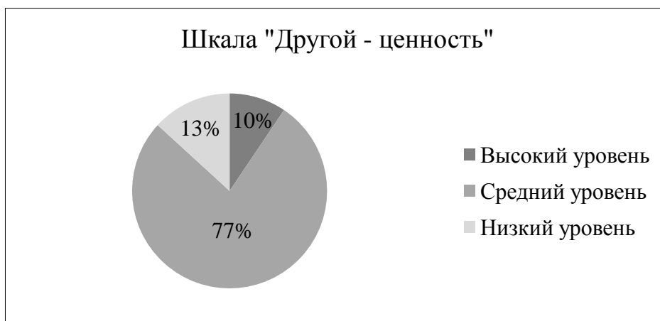
Рисунок 4 – Результат выявления степени выраженности ценностной установки у подростков по шкале «Я – другой»

Результатом анкетирования выявлен следующий уровень по шкале «Ответственность как ценность» – средний (52%), что выявляет способность подростков к рефлексивной деятельности по отношению к собственным совершенным поступкам и действиям. Рефлексия деятельности на данном возрастном этапе является одним из главных базисных характеристик полноценного гармонично развито личности для будущего функционирования как активного члена общества. Данные приведены на рисунке 5.