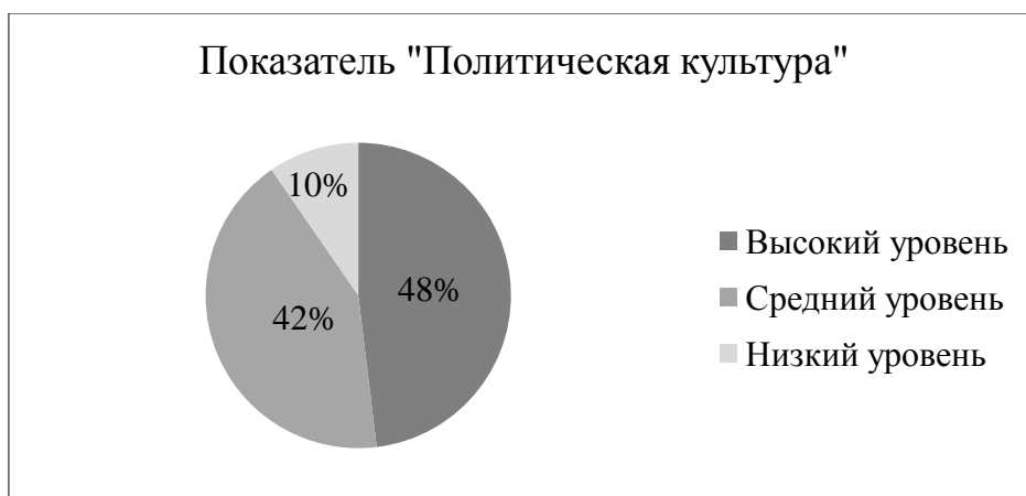
Рисунок 12 – Результат выявления степени выраженности ценностных качеств подростков по шкале «политическая культура»

Седьмой блок анкетирования «Патриотизм и интернациональность» выявил высокий уровень развития данного ценностного личностного качества подростков – 57%. Характеризуется высоким интересом к отечественной истории и культуры Родины, проявляют бережное отношение к национальным богатствам страны, к национальной культуре, участвуют в историко-патриотической работе. Данные приведены на рисунке 12.