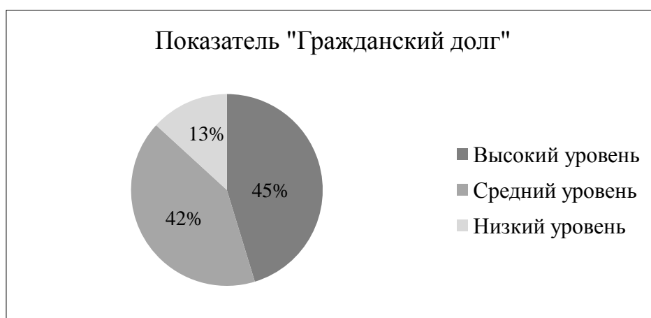
Рисунок 8 – Результат выявления степени выраженности ценностных качеств подростков по шкале «гражданский долг»