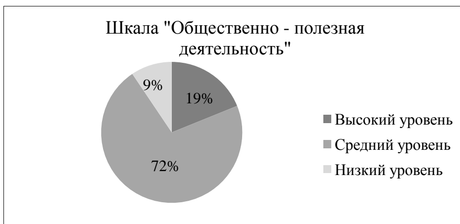
Рисунок 5 – Результат выявления степени выраженности ценностной установки у подростков по шкале «Общественно полезная деятельность»