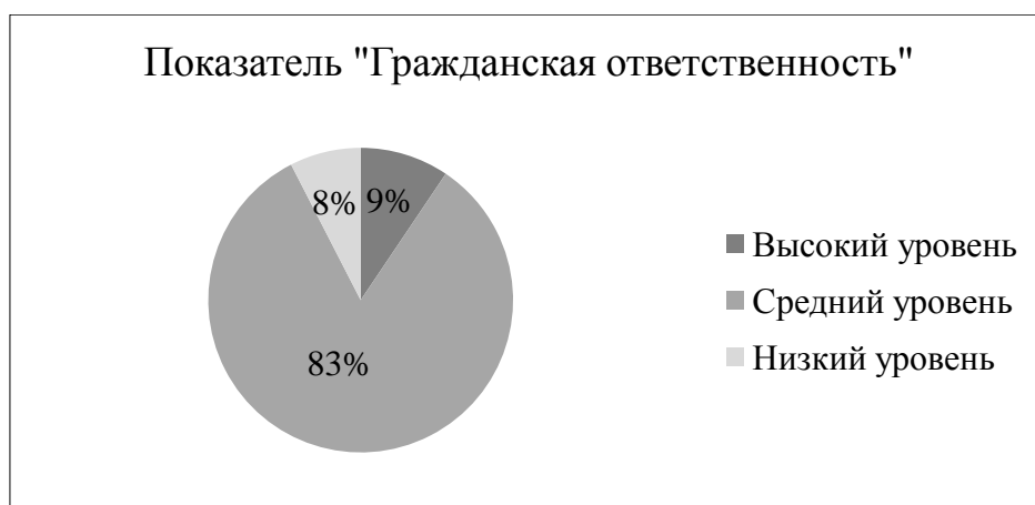
Рисунок 9 – Результат выявления степени выраженности ценностных качеств подростков по шкале «гражданская ответственность»