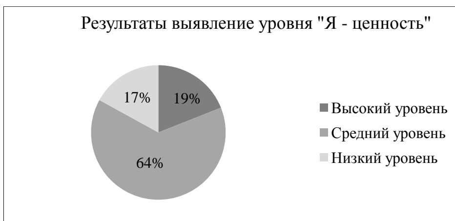
Рисунок 3 – Результат выявления степени выраженности ценностной установки у подростков по шкале «Я – ценность»

Результатом анкетирования выявлен следующий уровень по шкале «Общественно полезная деятельность» – средний (72%), что указывает на понимание подростками сущности общественной деятельности, но проявление инициативы со стороны старшеклассников не проявляется, чаще выполнение такого рода деятельности поступает как распоряжение, Данные приведены на рисунке 5.