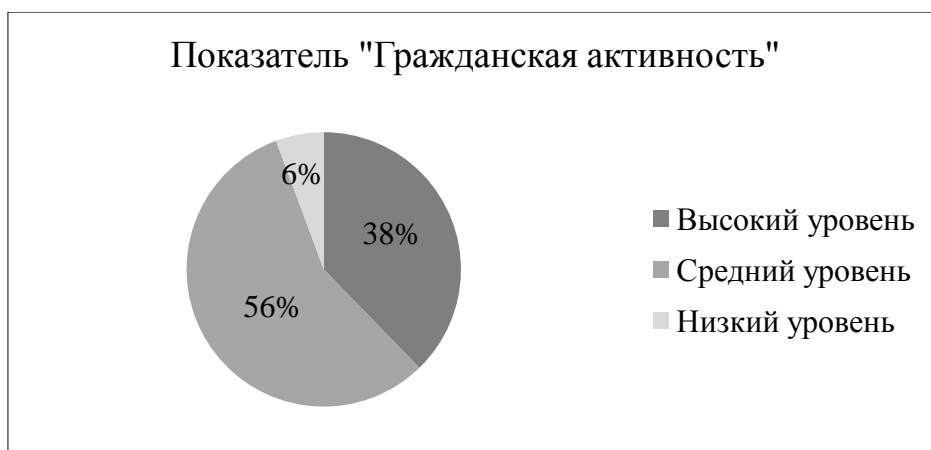
Рисунок 11 – Результат выявления степени выраженности ценностных качеств подростков по шкале «гражданская активность»