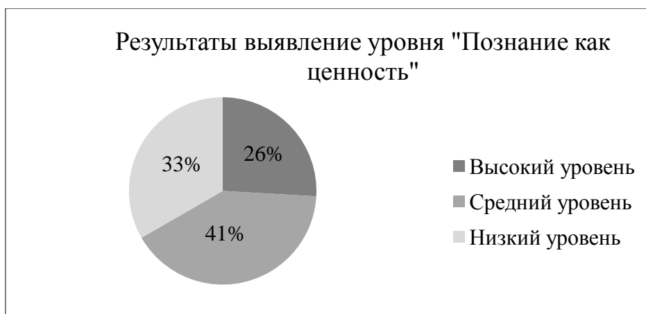
Рисунок 2 – Результат выявления степени выраженности ценностной установки у подростков по шкале «Познание как ценность»

проявление непонимания других людей. Данные приведены на рисунке 4.