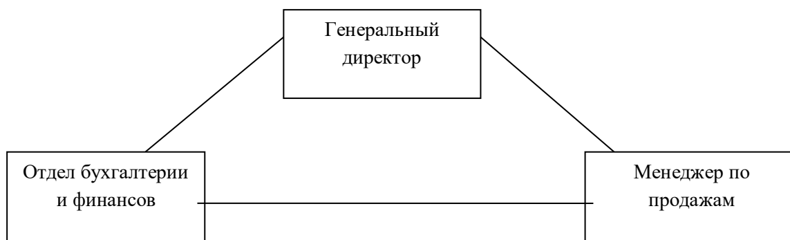
Рисунок 2.1 – Структурная схема предприятия ООО «Омега»

Сущность организационной структуры в делегировании прав и обязанностей для разделения труда. Организационная структура ООО «Омега» представлена на рисунке 2.1, позволяет рассмотреть и оценить функционирующие в организации структурные подразделения, связи между ними.