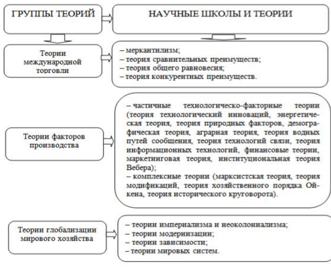
Рис.1 Концепции развития мирового хозяйства

торговли, теория факторов производства и теория глобализации мировой экономики. (рис. 1).