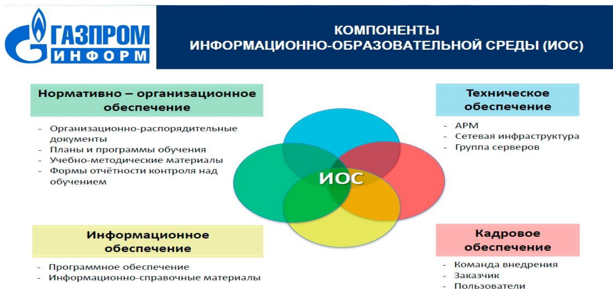
Рис.1- Информационно- образовательная среда

ООО «Газпром информ», дочерняя сервисная ИТ-компания ПАО «Газпром», осуществляет комплексное обслуживание пользователей и сопровождение информационных систем и ИТ-инфраструктуры «Газпрома», а также реализует инвестиционные проекты в области информатизации и информационной безопасности, выполняя функции генерального заказчика-застройщика Группы «Газпром» в вышеназванных областях [4]