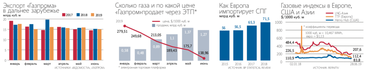
Рис.3- Статистика поставок