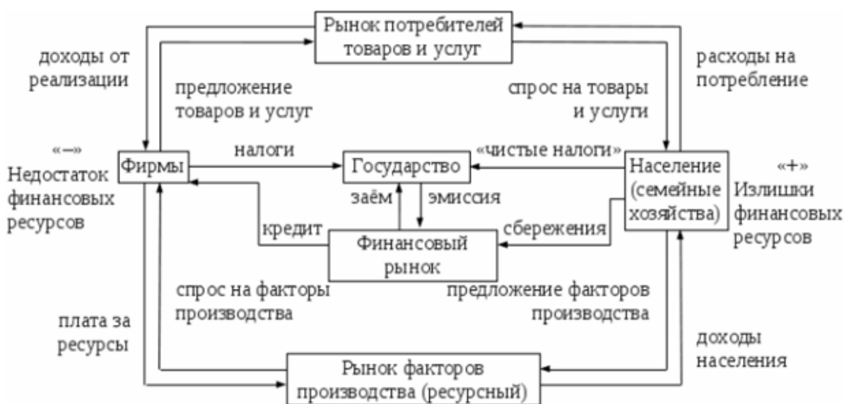
Схема 1. Рынок, базирующийся на товарно-денежных отношениях

Российская рыночная экономика представлена схематично, основывающаяся на применении товарно-денежных отношений[14].