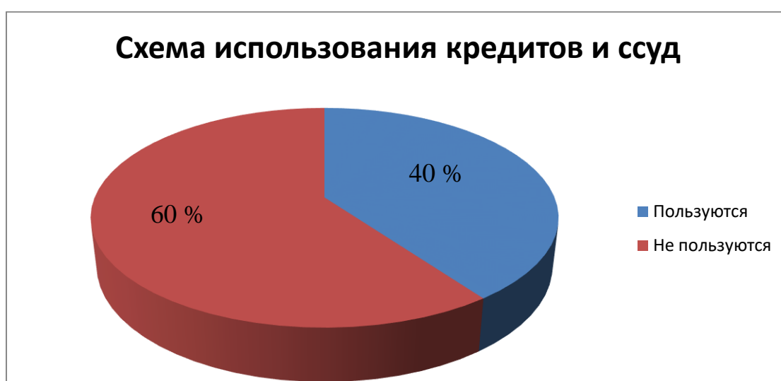
Рисунок 4 - Схема использования кредитов и ссуд

На рисунке 4 представлена схема использования кредитов и ссуд