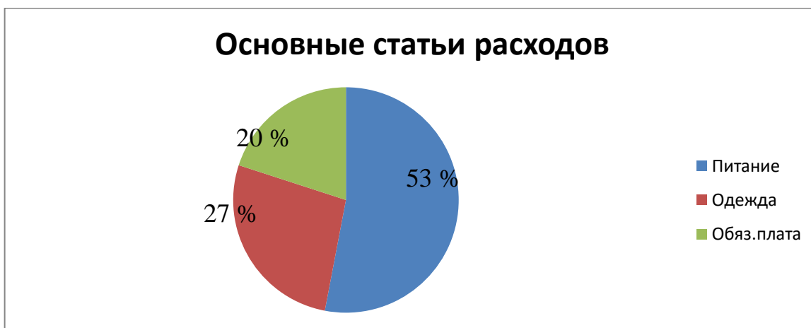
Рисунок 2 - Основные статьи расходов семьи

На рисунке 2 представлены основные статьи расходов семьи