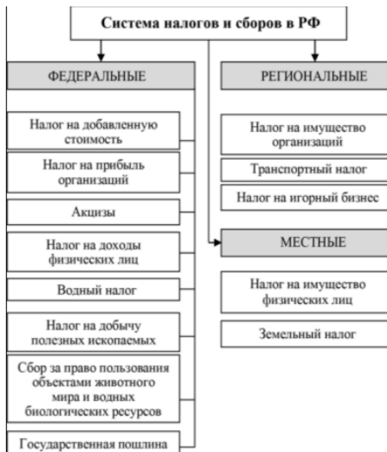
Рисунок 2 – Система налогов и сборов

Уровень налога определяет соответствующий уровень бюджета, зачислению в который он подлежит.