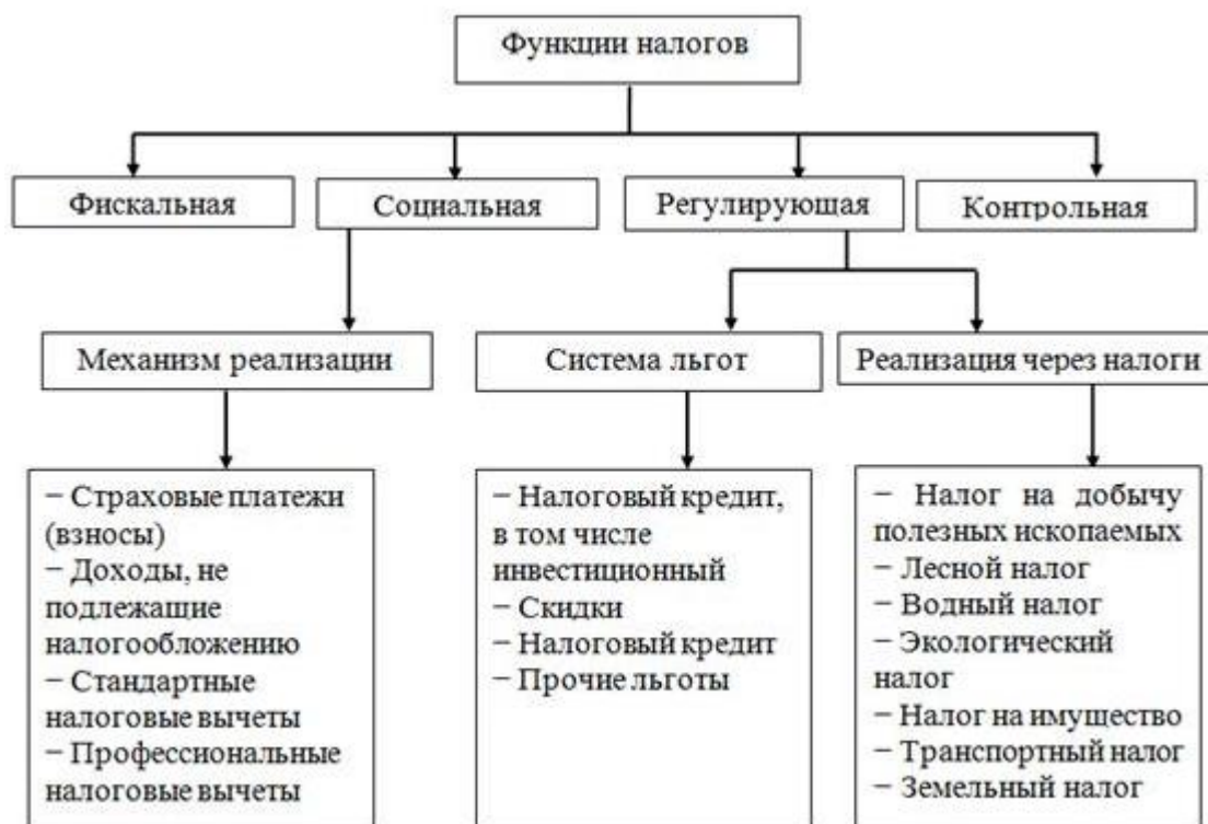
Рисунок 1 – Функции налогов

Налоговая система – это прежде всего совокупность налогов и сборов, взимаемых с плательщиков в порядке и на условиях, определенных НК РФ. Каждый человек должен уплачивать законно установленные налоги и сборы. Законодательство о налогах и сборах основано на признании всеобщности и равенства налогообложения.