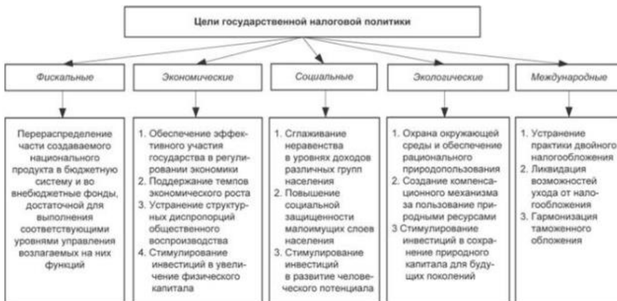
Рисунок 3 – Цели государственной налоговой политики

Выделяют три типа налоговой политики государства, а именно: