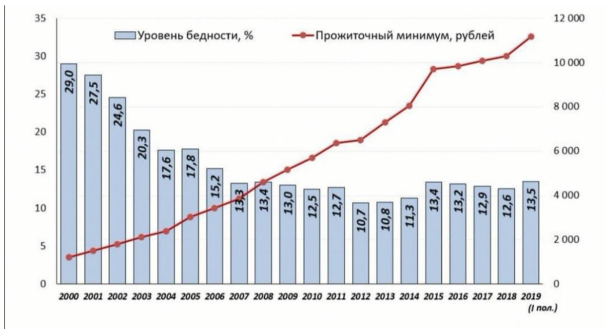
Рисунок 2 – Уровень бедности и прожиточный минимум в России 2000-2019 годы [7]

потребительской корзины и данных федерального органа исполнительной власти по статистике об уровне потребительских цен на продукты питания, непродовольственные товары и услуги, расходов по обязательным платежам и сборам. Показатель прожиточного минимума носит социальный характер и применяется для оценки уровня жизни населения, а также является важным ориентиром при установлении минимального размера оплаты труда [5].