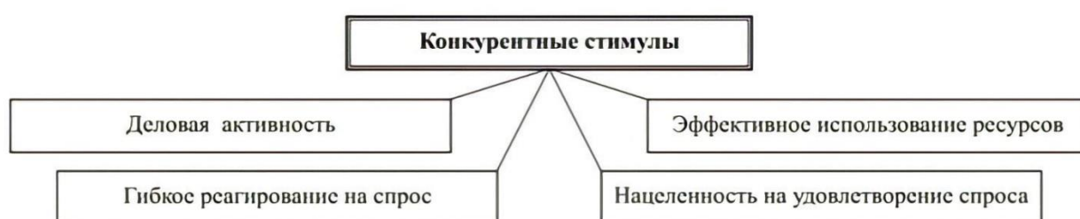
Рисунок 1 – Конкурентные стимулы [4]

При успехе одного из участников рыночной борьбы за счёт привилегий, либо путем лишения соперника возможности бороться в равных условиях, конкурентная борьба утрачивает стимул для повышения продуктивности работы, развитию научного-технического прогресса. Наглядно рассмотреть конкурентные стимулы в экономике поможет следующая схема. (Рисунок 1).