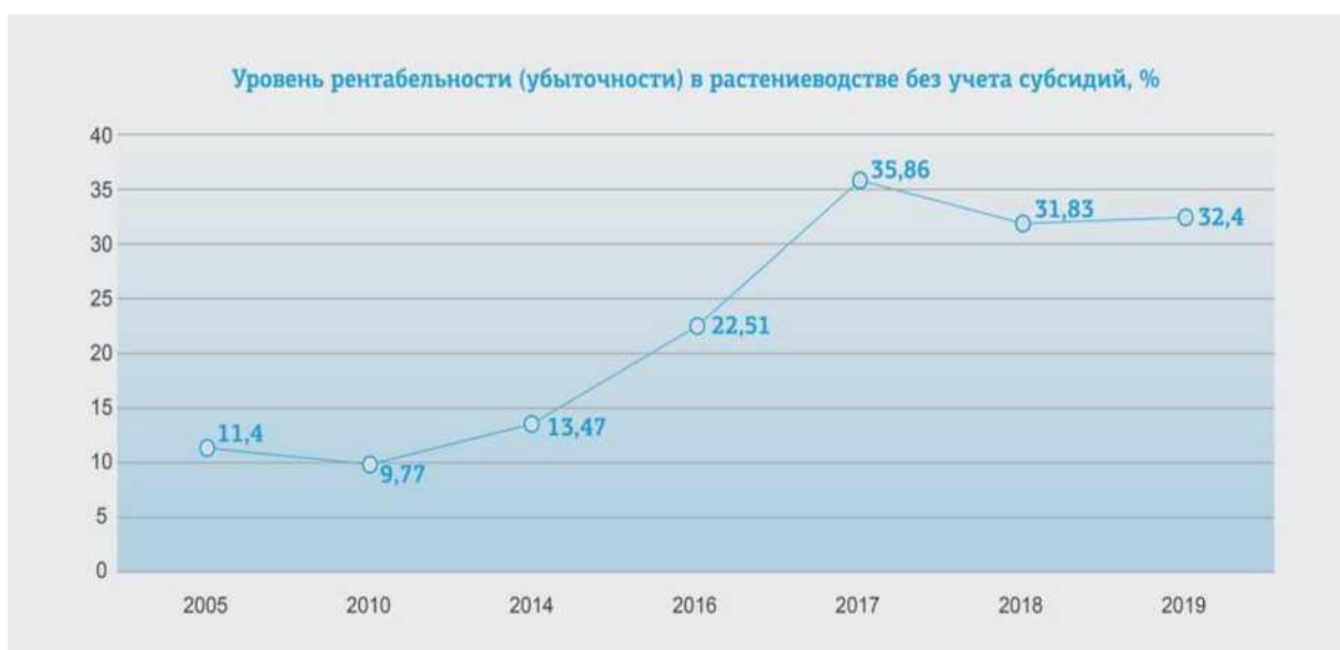
Рисунок 2 – Уровень рентабельности в растениеводстве, % [1]

С 2005 года рентабельность растениеводства в России стала постепенно увеличиваться, что можно увидеть на рисунке 2.