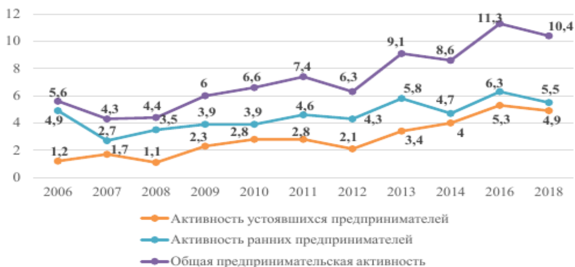
Рисунок 2 – Уровни предпринимательской активности в России 2006–2018 годы, % от взрослого трудоспособного населения [7]

Так же в нашей стране, как и в любом другом государстве, малый бизнес является движущей силой национальной экономики. К сожалению, на современном этапе развития страны в этом секторе бизнеса назрел ряд проблем, требующих их скорейшего решения, что в целом отражается на предпринимательской активности.