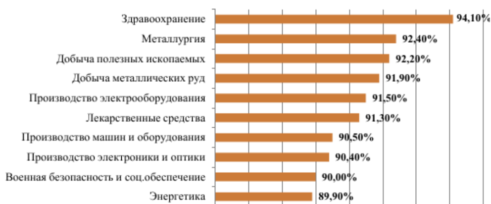
Рисунок 3 – Рейтинг сфер деятельности с наиболее высокой вероятностью достижения предприятиями малого и среднего бизнеса возраста 36 месяцев [7]

Кроме того, Сбербанк РФ ежегодно проводит исследования в сфере малого и среднего предпринимательства в России. Обратимся к полученным данным их исследования за 2018 год. Было проанализировано, сколько живет малый и средний бизнес в России. По мнению аналитиков проекта «СберДанные», более 70% компаний в стране живет три полных года и более. В среднем в мире около половины новых небольших предприятий работает до 5 лет, а треть – от 5 до 10 лет. Однако в нашей стране колоссальный разброс показателей в зависимости от региона регистрации и сферы деятельности.