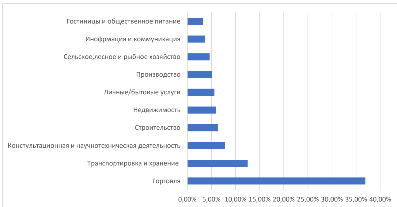
Рисунок 3 – Сферы предпринимательской деятельности по популярности ( составлен автором на основе [9] )

вызвана тем, что у россиян присутствует лояльность к традиционному шопингу. Более того, сфера торговли не вызывает значительных трудностей при организации предпринимательской деятельности.