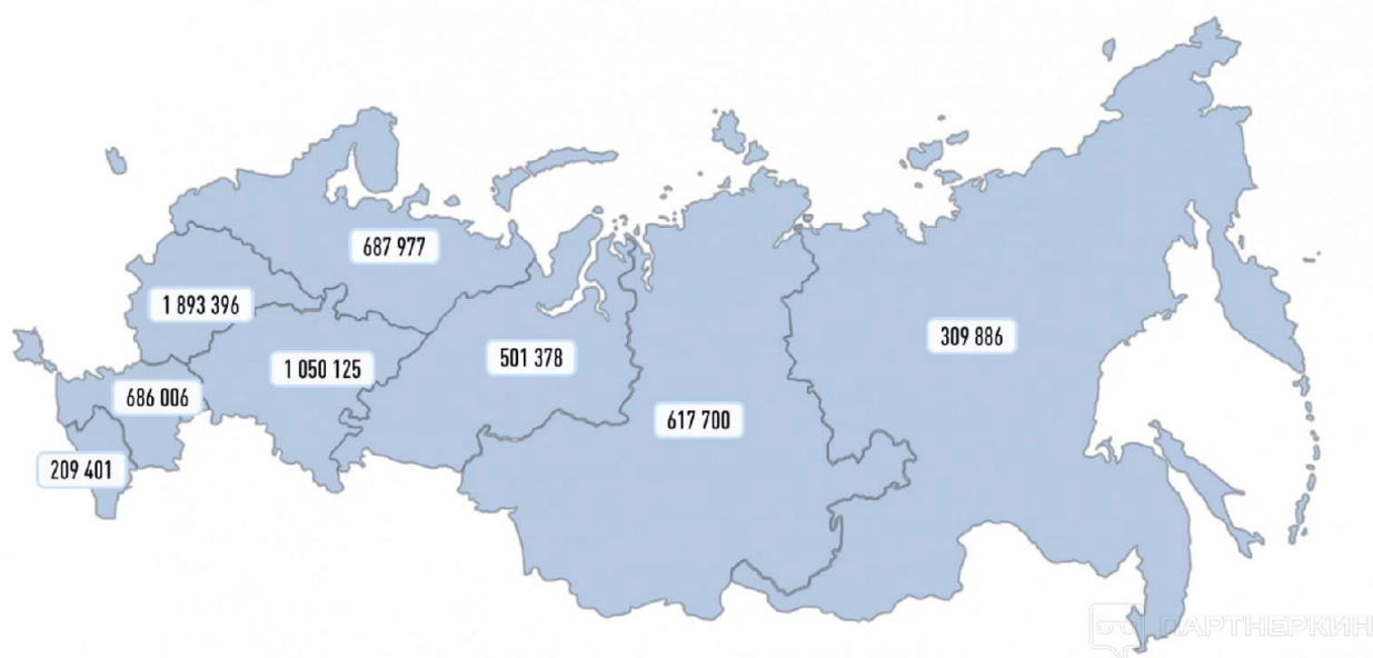
Рисунок 2 – Численность малых и средних предприятий

является Северо-Кавказский федеральный округ – 209 тыс. субъектов. Стоит отметить, что при сравнении ситуации с мартом 2021 года численность субъектов малых и средних предприятий на территории Российской Федерации увеличилась на 224 тыс. Это говорит о том, что рост произошел в тот момент, когда экономика достаточно сильно чувствовала ущерб от эпидемии на фоне заболевания Covid-19.