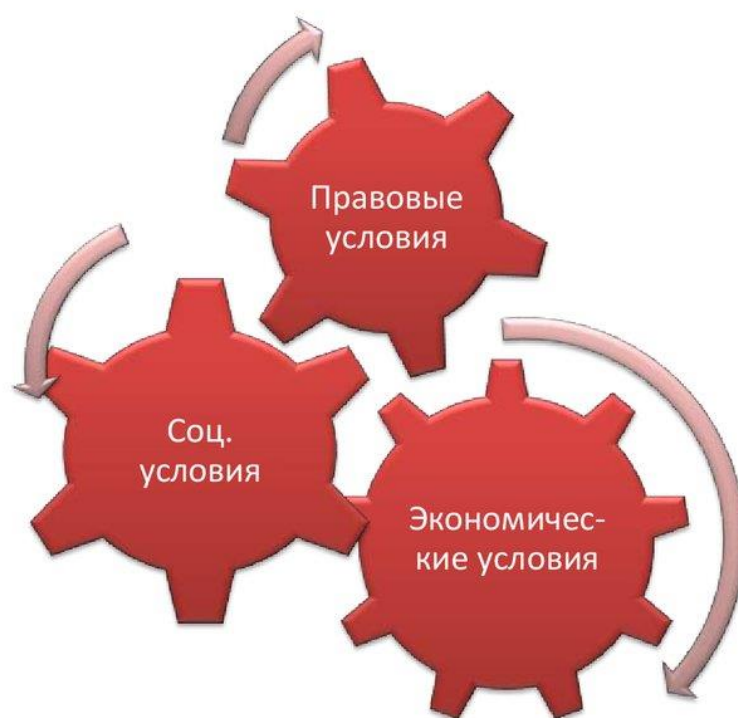
Рисунок А – Условия развития предпринимательства