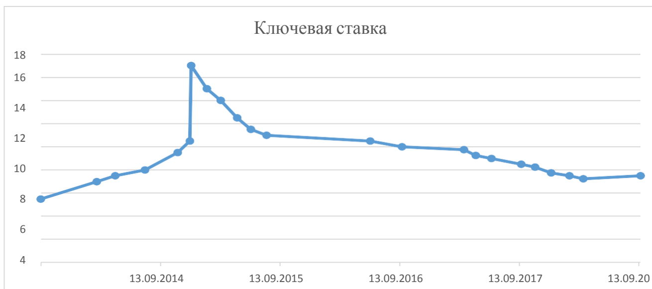
Рисунок 2 — Динамика ключевой ставки ЦБ РФ с 2013 года (составлен на основе [4])

Данный инструмент активно применяется Центральным банком. На графике отражено изменение ключевой ставки, а, значит, и ставок по операциям ЦБ.