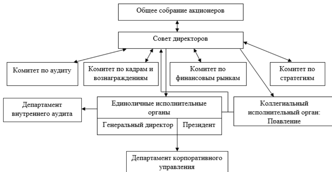
Рисунок 2.1 – Организационная структура ПАО «Магнит» [29]

ПАО «Магнит» имеет эффективную систему корпоративного управления и внутреннего контроля финансово-хозяйственной деятельности, соответствующую российскому законодательству, правилам Московской биржи, а также лучшим международным практикам. Компания постоянно совершенствует корпоративное управление, соблюдая при этом права акционеров и других заинтересованных сторон (рисунок 2.1).