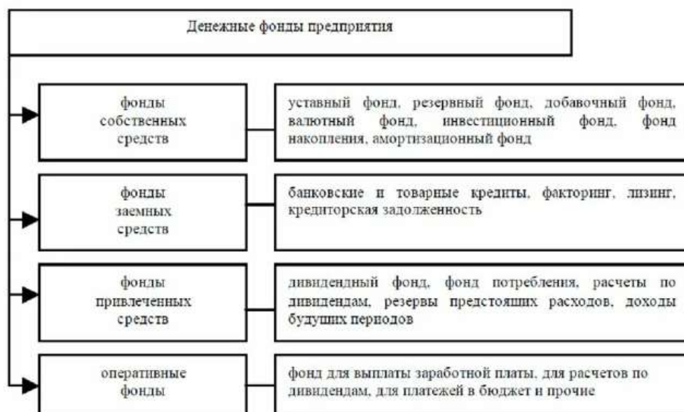
Рисунок 1.1 – Группы денежных фондов на предприятии [11]

вкладов (долей, акций, паевых взносов) учредителей, его формирование зависит от организационно-правовой формы.