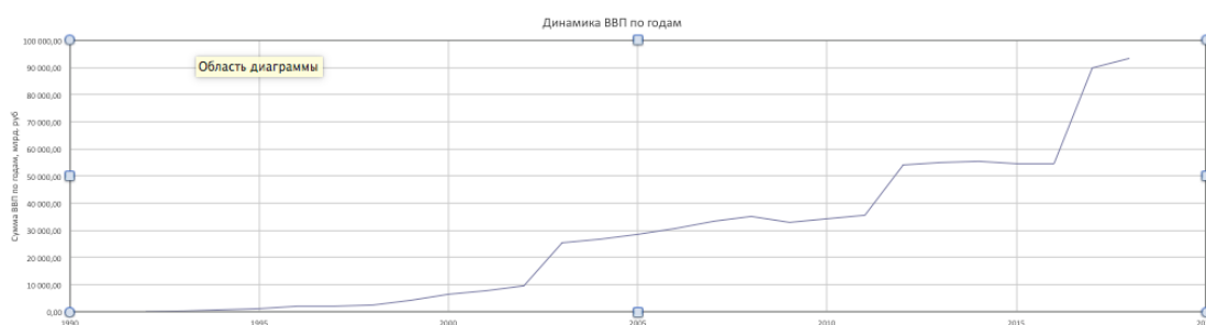
Рисунок 1 – Динамика ВВП по годам

На практике это означает, что в ВВП включаются результаты деятельности всех предприятий, организаций, учреждений и других единиц, которые функционируют на экономической территории данной страны, включая предприятия, полностью контролируемые иностранным капиталом, а также филиалы иностранных компаний.